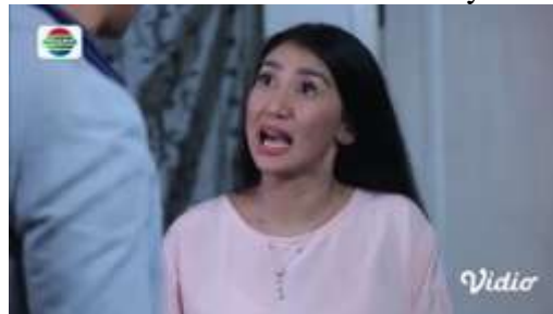
Gambar.16 Istri menakut-nakuti suaminya

Gambar diatas menunjukkan terjadinya adegan mengancam yang dilakukan oleh seorang istri yang mengancam akan membawa kabur anaknya setelah lahir nanti karena geram melihat perbuatan sang suami, dengan narasi sebagai berikut :