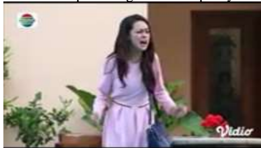
Gambar.31 Kakak ipar menghina adik iparnya

Gambar diatas menunjukkan terjadinya adegan menghina yang dilakukan oleh seorang kakak ipar yang tidak menyukai istri adiknya sendiri karena miskin, semakin membencinya setelah mengetahui sang istri dari adiknya ini hamil namun dia tidak bisa hamil (iri). Dengan narasi sebagai berikut :