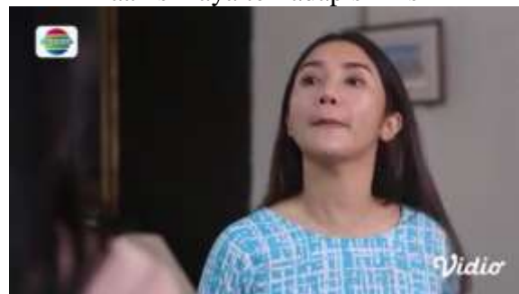
Gambar.37 Hinaan si kaya terhadap si miskin

Gambar diatas menunjukkan terjadinya adegan menghina yang dilakukan oleh pelaku dan korban yang sama seperti adegan sebelumnya, namun kali ini sang pelaku telah mendapatkan apa yang ia inginkan yakni merebut suami dari sang korban, namun sang korban ingin mendapatkan anaknya yang dibawa pergi oleh suaminya, disinilah pelaku mulai menghina korban. Dengan narasi sebagai berikut :