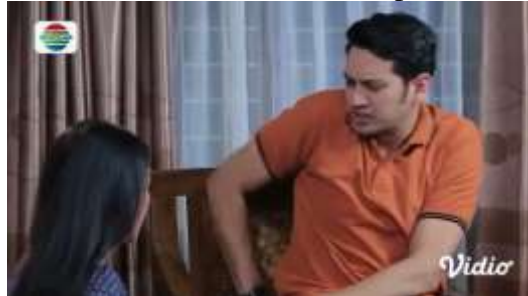
Gambar.17 Kekesalan suami terhadap istri

Gambar diatas menunjukkan terjadinya adegan mengancam yang dilakukan oleh seorang suami kepada istrinya, yang mengeluh kesal karena sang istri selalu meminta uang kepadanya. Padahal uang yang diminta sang istri untuk membeli obat ibunya yang sedang sakit, dengan narasi sebagai berikut :