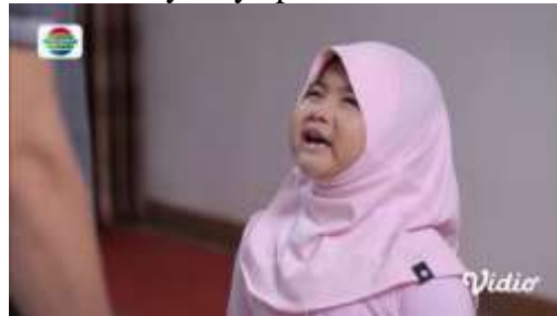
Gambar.24 Seorang anak menuduh ayahnya pembunuh

Gambar diatas menunjukkan terjadinya adegan menfitnah yang dilakukan oleh seorang anak yang menuduh ayah tirinya membunuh neneknya sendiri, dengan narasi sebagai berikut :