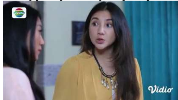
Gambar.34 Seorang perempuan menghina perempuan lain

Gambar diatas menunjukkan terjadinya adegan menghina yang dilakukan oleh seorang perempuan kepada seorang perempuan lain, pelaku berusaha merebut suami dari korban dengan menganggap bahwa korban miskin dan mau jika dibayar dengan uang yang banyak. Dengan narasi sebagai berikut :