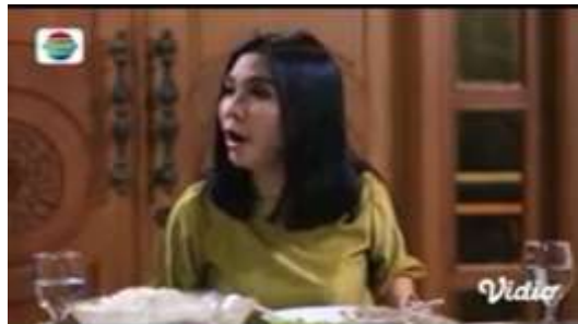
Gambar.7 Mertua mengumpat menantunya karna salah masak

Gambar diatas menunjukkan terjadinya adegan mengumpat yang dilakukan oleh pelaku yang sama seperti pada adegan sebelumnya yakni ibu mertua kepada menantunya karena memasak masakan yang salah, dengan narasi sebagai berikut :