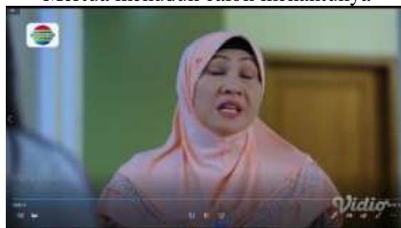
Gambar.20 Mertua menuduh calon menantunya

Gambar diatas menunjukkan terjadinya adegan menfitnah yang dilakukan oleh seorang ibu mertua kepada mantan menantunya dengan