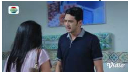
Gambar.25 Suami menfitnah istrinya

Gambar diatas menunjukkan terjadinya adegan menfitnah yang dilakukan oleh seorang suami kepada istrinya dengan tuduhan bahwa sang istri lah yang menjelakakan saudara juga ayahnya, dengan narasi sebagai berikut :