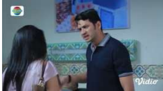
Gambar.10 Umpatan suami yang tidak menghargai istri

Gambar diatas menunjukkan terjadinya adegan mengumpat yang dilakukan oleh seorang suami kepada istrinya yang menganggap bahwa istrinya ini hanya pembawa masalah dan tidak berguna, dengan narasi sebagai berikut :