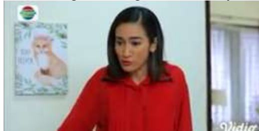
Gambar.14 Seorang ibu mengancam anaknya

Gambar diatas menunjukkan terjadinya adegan mengancam yang dilakukan oleh seorang ibu kepada anaknya yang telah mengadu perlakuan kasar sang ibu kepada neneknya, yang pada akhirnya sang ibu kena marah juga nasehat dari si nenek. Dengan narasi sebagai berikut :