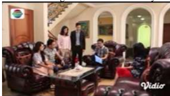
Gambar.15 Mertua mengancam calon menantunya

Gambar diatas menunjukkan terjadinya adegan mengancam yang dilakukan oleh calon ayah mertua kepada calon menantunya dengan mengancam berupa tanda tangan perjanjian agar calon menantunya tidak semena-mena menggunakan harga milik keluarga calon suami, karena calon istrinya ini seorang anak pembantu yang miskin. Dengan narasi sebagai berikut :