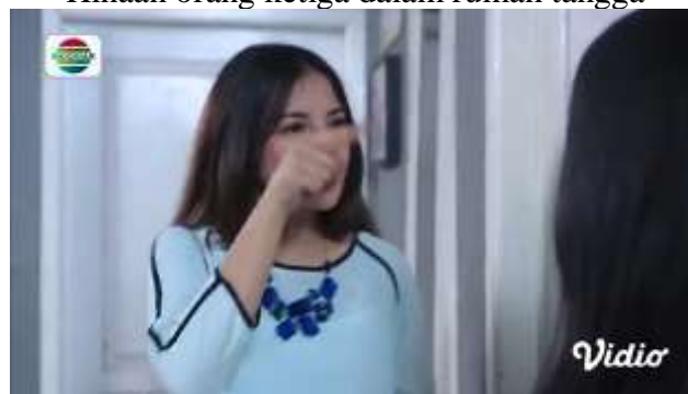
Gambar.35 Hinaan orang ketiga dalam rumah tangga

Gambar diatas menunjukkan terjadinya adegan menghina yang dilakukan oleh pelaku yang sama seperti pada adegan sebelumnya dengan tujuan yang sama juga untuk merebut suami korban, karena tujuannya belum tercapai terjadilah penghinaan kepada korban. Dengan narasi sebagai berikut :