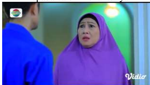
Gambar.3 Umpatan seorang mertua kepada calon menantunya

Gambar diatas menunjukkan terjadinya adegan mengumpat yang dilakukan oleh seorang ibu kepada calon menantunya, karena sang menantu merupakan adek kandung dari istri anaknya yang juga mengira bahwa memiliki kelakuan yang sama dengan kakaknya. Dengan narasi sebagai berikut :