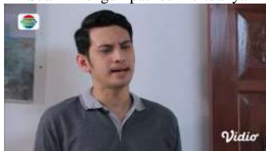
Gambar.9 Suami mengumpat ibu mertuanya

Gambar diatas menunjukkan terjadinya adegan mengumpat yang dilakukan oleh seorang suami yang mengumpat mertuanya yang baru saja meninggal melalui istrinya dihadapan para jamaah pengajian di rumahnya lalu mengusirnya, dengan narasi sebagai berikut :