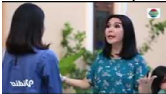
Gambar.43 Mertua mencela menantunya

Gambar diatas menunjukkan terjadinya adegan mencela yang dilakukan oleh seorang mertua yang selalu menganggap rendah sang menantu, karena menurut sang mertua menantunya ini hanya akan memanfaatkan harta anaknya saja sehingga terlontarkan kata celaan dalam adegan ini. Dengan narasi sebagai berikut: