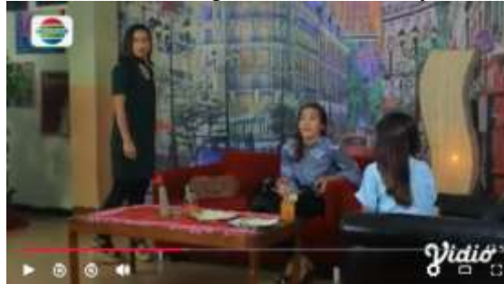
Gambar.28 Teman menghina teman lainnya

Gambar diatas menunjukkan terjadinya adegan menghina yang dilakukan oleh kedua orang teman kepada satu temannya bahwa si temannya ini barang-barang yang dipakainya palsu disinilah kedua temannya menghina satu temannya ini, dengan narasi sebagai berikut :