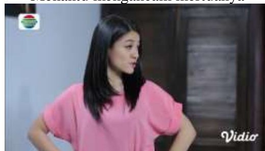
Gambar.18 Menantu mengancam mertuanya

Gambar diatas menunjukkan terjadinya adegan mengancam yang dilakukan oleh seorang istri baru kepada ayah mertuanya sendiri, lantaran kesal dengan sang ayah mertua yang hanya sakit-sakitan saja. Dengan narasi sebagai berikut :