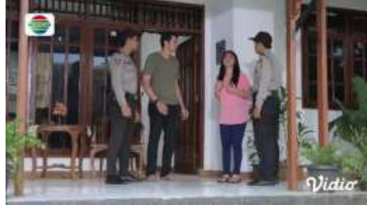
Gambar.26 Istri menuduh suami menjalankan bisnis ilegal

Gambar diatas menunjukkan terjadinya adegan menfitnah yang dilakukan oleh istri baru kepada suaminya dengan tuduhan bahwa sang suaminya yang menjalankan bisnis ilegal menggunakan nama istri barunya, dengan narasi sebagai berikut :