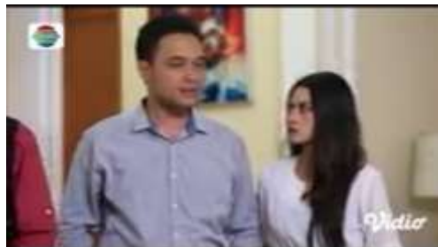
Gambar.33 Menghina lantaran keadaan ekonomi

Gambar diatas menunjukkan terjadinya adegan menghina yang dilakukan oleh kakak kepada adiknya yang tidak menyukai istri dari adiknya karena miskin, ia menganggap bahwa istrinya ini tidak selevel dengannya juga dengan keluarganya. Dengan narasi sebagai berikut :