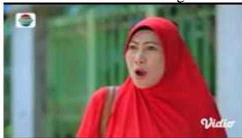
Gambar.1 Mertua mengumpat menantu karna selingkuh

Gambar diatas menunjukkan terjadinya adegan mengumpat yang dilakukan oleh seorang ibu yang mengumpat menantunya sendiri karena melihat si menantu jalan dengan laki-laki lain, dengan narasi sebagai berikut :