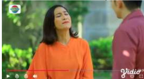
Gambar.42 Istri mencela suaminya

Gambar diatas menunjukkan terjadinya adegan mencela yang dilakukan oleh seorang istri kepada suaminya bahwa sang suami hanya merepotkan hidupnya karena tidak mampu mencukupi kebutuhan dari sang istri, dengan narasi sebagai berikut :