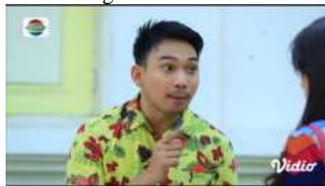
Gambar.27 Menghina keadaan fisik

Gambar diatas menunjukkan terjadinya adegan menghina yang dilakukan oleh seorang laki-laki kepada kekasihnya bahwa sang adik kekasihnya jauh lebih cantik daripada kekasihnya tersebut, dengan narasi sebagai berikut: