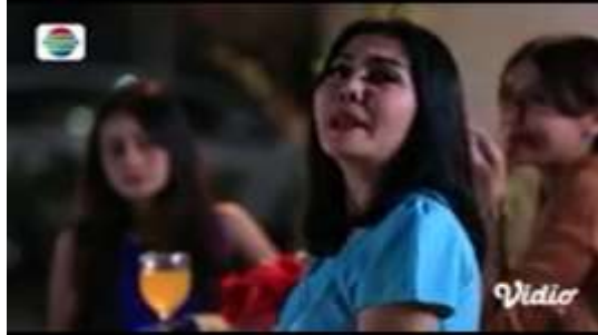
Gambar.6 Umpatan dengan mempermalukan orang lain

Gambar diatas menunjukkan terjadinya adegan mengumpat yang dilakukan oleh ibu mertua kepada menantunya yang miskin karena dandan terlalu menor saat datang menyusul ke seminar suaminya padahal itu hasil riasan dari kakak ipar dan temannya yang sengaja untuk mempermalukannya dengan narasi sebagai berikut :