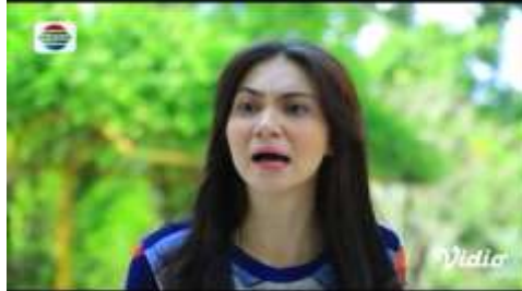
Gambar.2 Perempuan mengumpat mantan kekasihnya

Gambar diatas menunjukkan terjadinya adegan mengumpat yang dilakukan oleh seorang perempuan kepada mantan kekasihnya, karena telah mencintai adek kandungnya sendiri padahal baru saja putus dengannya. Dengan narasi sebagai berikut :