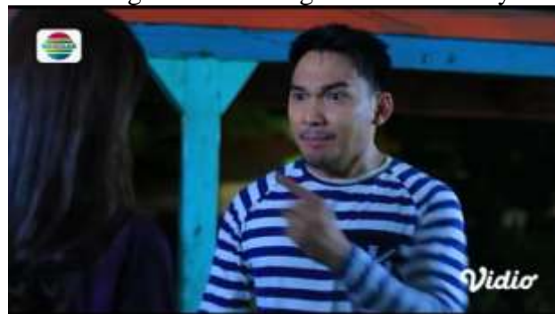
Gambar.13 Seorang laki-laki mengancam kekasihnya

Gambar diatas menunjukkan terjadinya adegan mengancam yang dilakukan oleh seorang laki-laki kepada kekasihnya dengan mengancam kekasihnya karena tidak memberi uang dalam tabungannya, dengan narasi sebagai berikut :