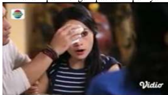
Gambar.5 Kakak ipar mengumpat adik iparnya

Gambar diatas menunjukkan terjadinya adegan mengumpat yang dilakukan oleh kakak ipar kepada adik iparnya yang menurutnya kampungan karena tidak bisa memotong daging yang akan dimakan, akibatnya daging itu meloncat kena si kakak ipar. Dengan narasi sebagai berikut :