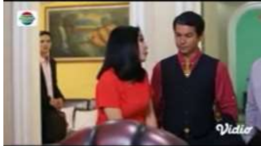
Gambar.8 Mertua mengumpat menantunya yang miskin

Gambar diatas menunjukkan terjadinya adegan mengumpat yang dilakukan oleh pelaku yang sama seperti pada adegan sebelumnya yakni ibu mertua yang tidak suka jika mempunyai menantu miskin, dengan narasi sebagai berikut :