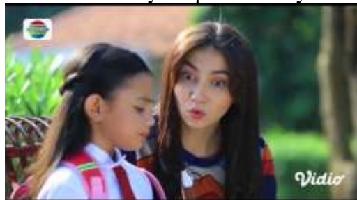
Gambar.19 Seorang ibu menjelek-jelekan sifat tantenya kepada anaknya

Gambar diatas menunjukkan terjadinya adegan menfitnah yang dilakukan oleh seorang ibu kepada tante dari anaknya sendiri, disini terlihat bahwa sang ibu mempengaruhi anaknya untuk membenci tantenya dengan menggunakan tuduhan kepada tantenya ini. Dengan narasi sebagai berikut :