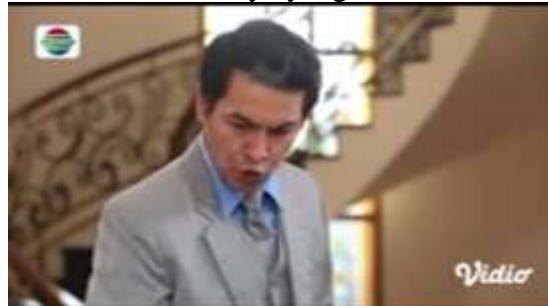
Gambar.32 Mertua menghina menantunya yang miskin

Gambar diatas menunjukkan terjadinya adegan menghina yang dilakukan oleh seorang ayah mertua yang tidak terima jika menantunya yang miskin itu hamil karena ia tak ingin ada keturunan miskin di keluarganya, dengan narasi sebagai berikut :