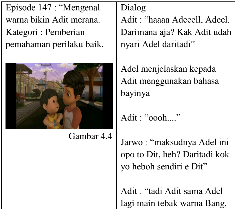
Tabel 4.2 Visualisasi Pemahaman Perilaku Baik – Buruk, Benar – Salah, Sopan Dan Tidak Sopan.

“Dan janganlah kamu memalingkan wajah dari manusia (karena sombong) dan janganlah berjalan di bumi dengan angkuh. Sungguh, Allah tidak menyukai orang-orang yang sombong dan membanggakan diri”. (QS. Luqman : 18) 4