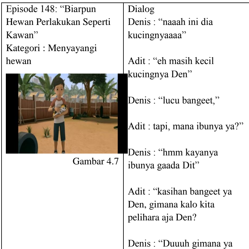
Tabel 4.3 Visualisasi arti kasihan dan sayang kepada ciptaan Tuhan

“dan Sesungguhnya pada hewan hewan ternak terdapat suatu pelajaran bagimu. Kami memberi minum kamu dari (air susu) yang ada dalam perutnya, dan padanya juga terdapat banyak manfaat untukmu, dan sebagian darinya kamu makan. (QS. Al Mukminun : 21) 5