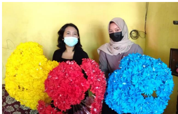
Produk Bunga Kertas Kampung Pelangi Semarang