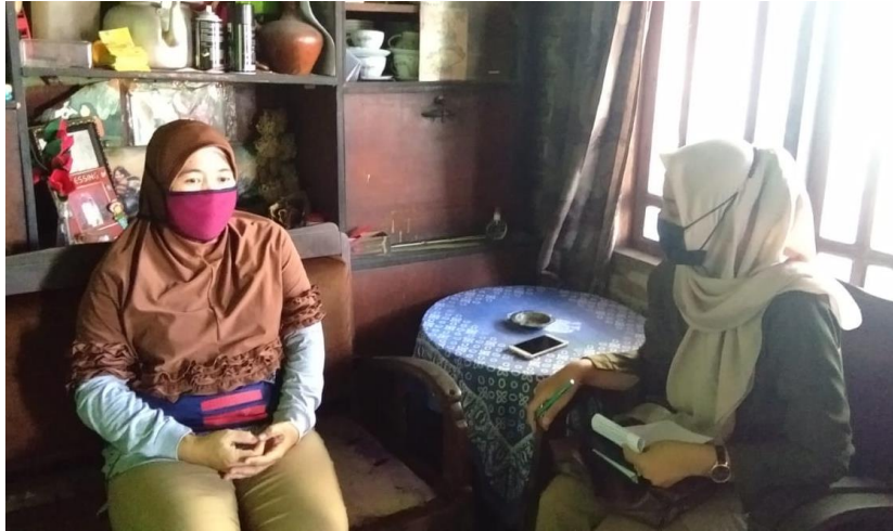
Wawancara dengan pelaku home industry bunga kertas