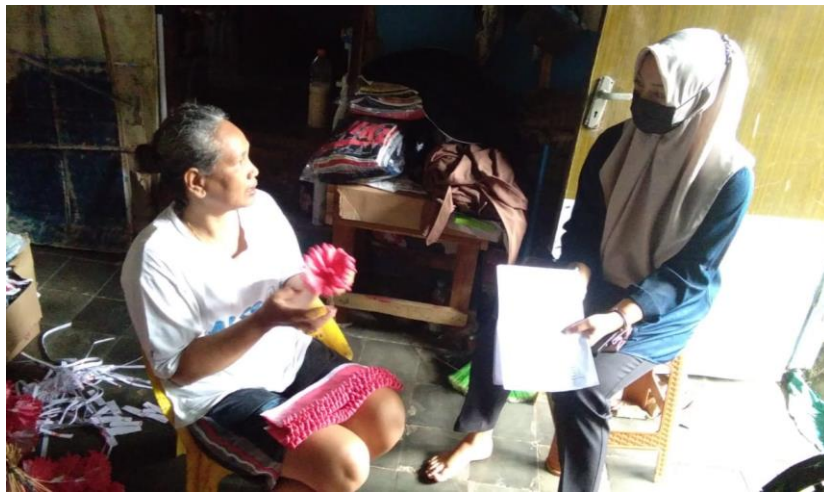
Wawancara dengan pelaku home industry bunga kertas