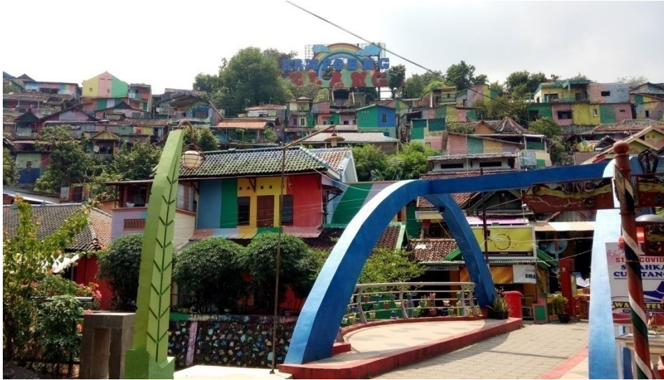
Kampung Pelangi Semarang