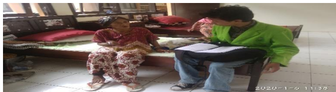
Wawancara dengan lansia di PWHI