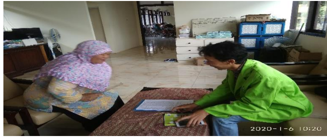
Wawancara dengan pembimbing agama Islam di PWHI