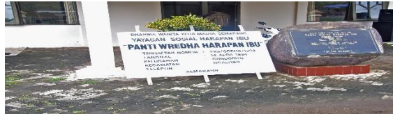
Gedung Panti Wredha Harapan Ibu Ngaliyan Semarang