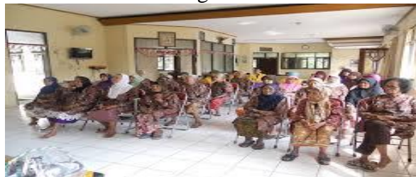
Bimbingan Agama Islam di PWHI