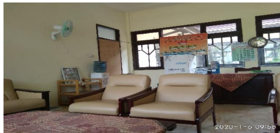
Ruang Kantor PWHI