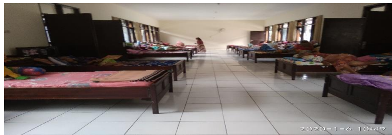
Kamar lansia di PWHI