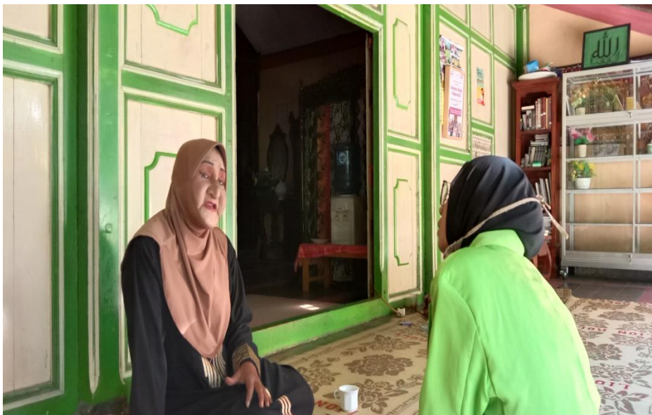
Wawancara dengan ketua pondok pesantren waria Al-Fatah Yogyakarta. (19 September 2020)