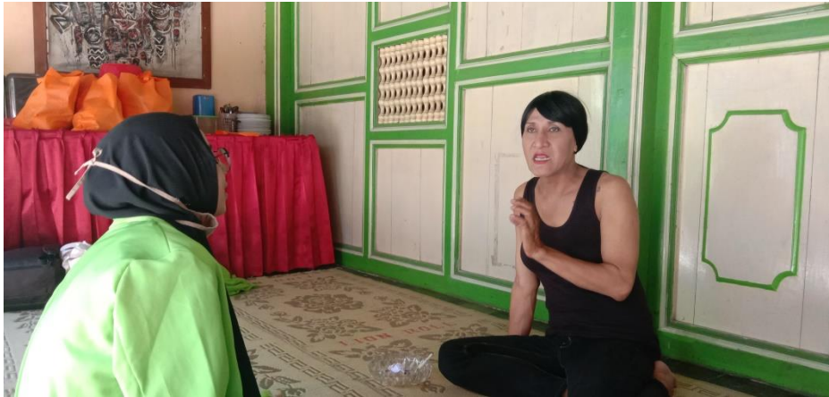
Wawancara dengan santri pondok pesantren waria Al-Fatah Yogyakarta. (19 September 2020)