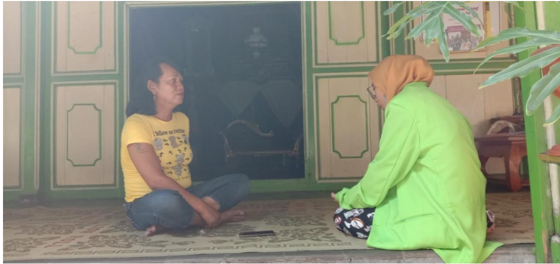
Wawancara dengan santri pondok pesantren waria Al-Fatah Yogyakarta.