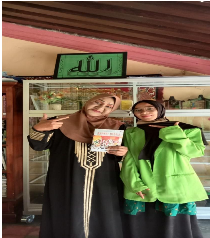
Buku tentang santri waria (19 september 2020)