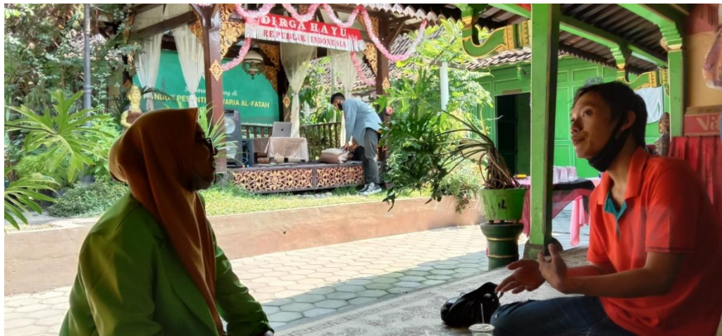
Wawancara dengan santri pondok pesantren waria Al-Fatah Yogyakarta.(18 September 2020)