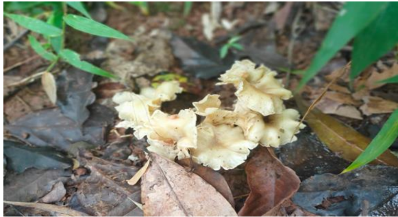
Gambar 3. Penampakan Jamur Termitomyces sp.

Nigeria menggunakan jamur Termitomyces sp. untuk mengobati penyakit gonorehe (Oso, 1977). Termitomyces sp. juga dapat digunakan untuk meningkatkan sistem imun, mengatasi masalah pencernaan seperti sembelit, sakit perut, maag (Tibuhwa, 2012). Termitomyces sp. digunakan untuk menurunkan tekanan darah tinggi, menyembuhkan diare dan rhematik (Sachan et al. , 2013), membantu penyembuhan luka dan proses pembekuan darah (Chandrawati et al. , 2014), mengobati demam, pilek dan infeksi jamur di India (Venkatachalapathi & Paulsamy, 2016).