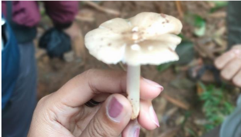
Gambar 5. Penampakan Jamur Pleurotus ostreatus

yang banyak dan sering dikonsumsi. Jamur yang memiliki kenampakan berwarna putih dengan campuran krem ini berbentuk seperti kipas bergelombang. Jamur ini mampu tumbuh di sekitar kayu mati dan serasah daun, sehingga jamur ini sering ditemukan di sekitar hutan (Stamets, 2000). Dokumentasi jamur P. ostreatus terlihat pada Gambar 5.