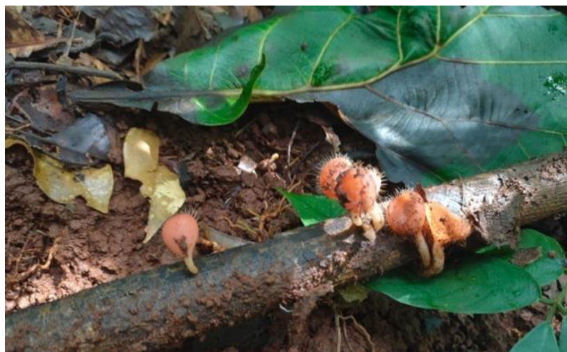
Gambar 4. Penampakan Jamur Ascomycota cookiena (Dokumentasi Penelitian)

Jamur A. cookiena biasa disebut sebagai jamur mangkuk seperti bentuk tubuhnya. Jamur ini diketahui dapat digunakan sebagai obat bagi balita yang pada malam hari sering kencing.