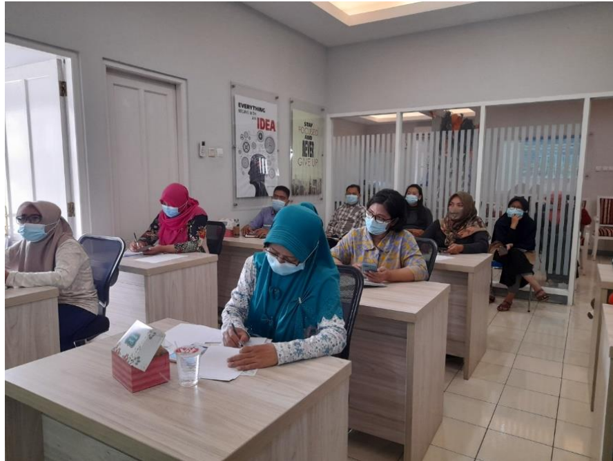
Gambar 5 Pemberian Materi Untuk Pelaku UMKM