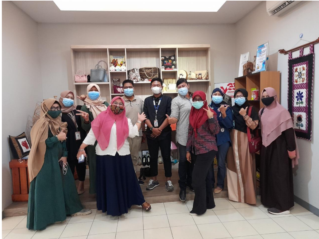
Gambar 6 Potret Keakraban Pelaku UMKM