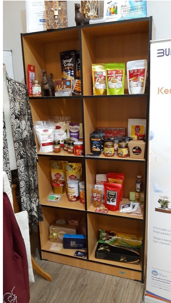
Produk Pelaku UMKM