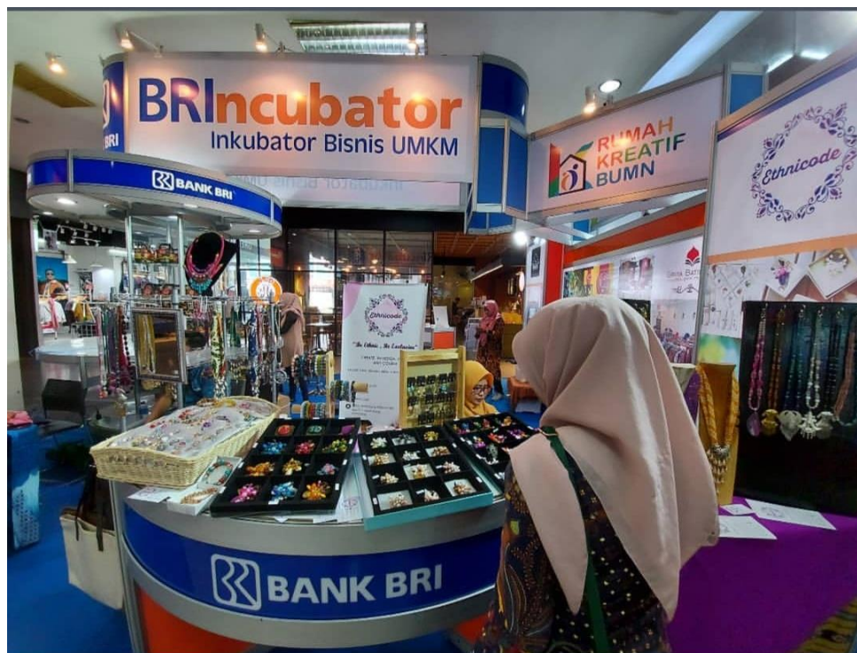
Gambar 4 Gemerlap Expo Sebelum Pandemi Tahun 2019