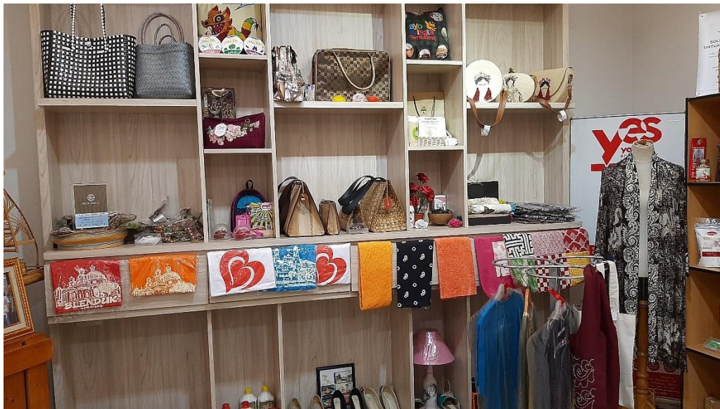
Produk Pelaku UMKM