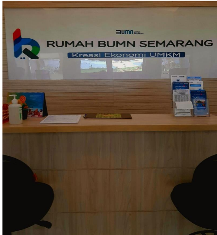
Gambar 1 Rumah BUMN Semarang

Rumah BUMN Semarang adalah rumah yang dibangun Kementerian BUMN bersama perusahaan milik negara sebagai rumah bersama untuk berkumpul, belajar dan membina para pelaku UMKM menjadi UMKM yang berkualitas. Awal berdirinya yaitu pada tanggal 1 September 2017, awal berdiri bernama Rumah Kreatif BUMN Semarang (RKB Semarang) namun pada tanggal 11 Agustus 2020 diganti menjadi Rumah BUMN Semarang. Rumah BUMN Semarang berada di Jl.Sultan Agung No. 108 Semarang, lokasinya tidak jauh dari pusat kota yaitu berjarak kurang lebih 4,3 Km. Terhitung sudah ada 4000 UMKM yang bekerjasama di Rumah BUMN Semarang.