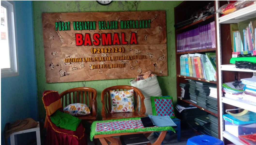
Kantor pusat PKBM Basmala