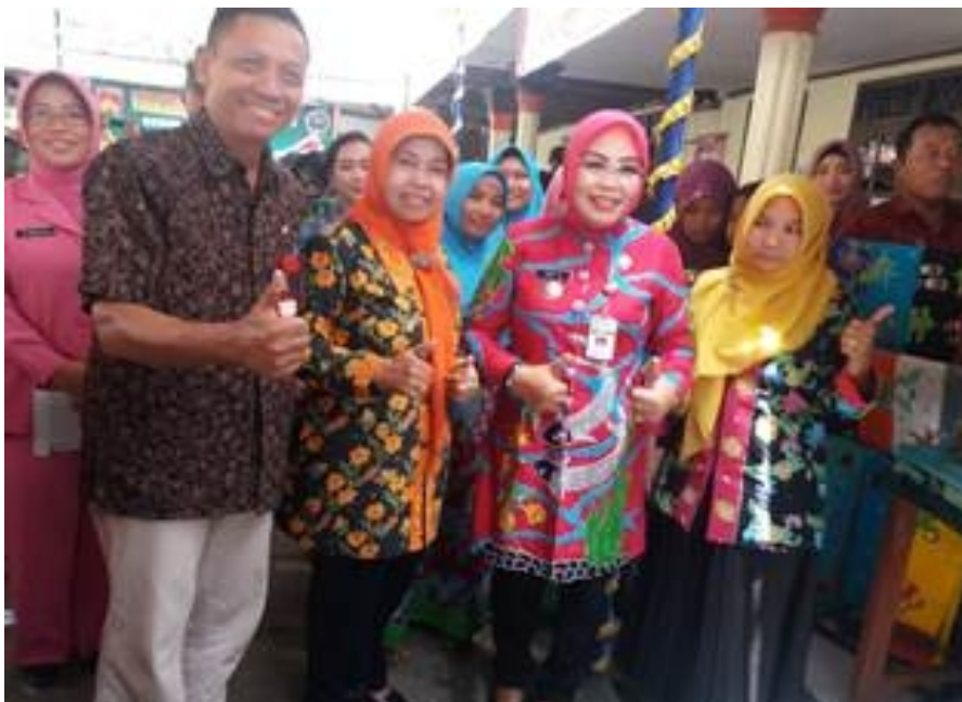
Kunjungan Bupati Grobogan dan kepala bapermades Kabupaten Grobogan di stan Batik PKBM Basmala