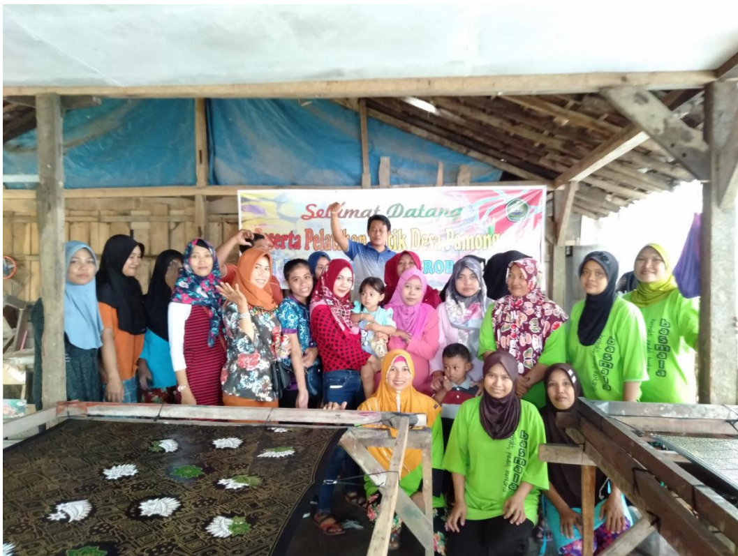
Pelatihan membuat Batik Tulis di PKBM Basmala