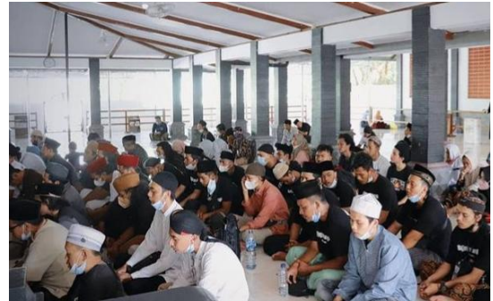
KEGIATAN ISTIGHASAN SANTRI REHABILITASI