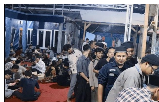
PENGAJIAN RUTIN SANTRI REHABILITASI SENIN MALAM