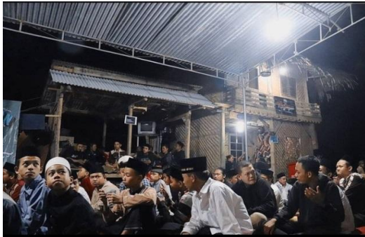
KEGIATAN PENGAJIAN KITAS SANTRI REHABILITASI