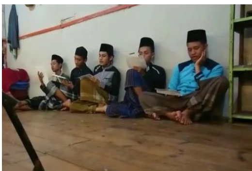
KEGIATAN NGAJI IQRA' DAN AL-QUR'AN SANTRI REHABILITASI