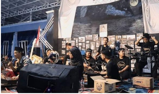
KEGIATAN SHOLAWAT METAL SANTRI REHABILITASI