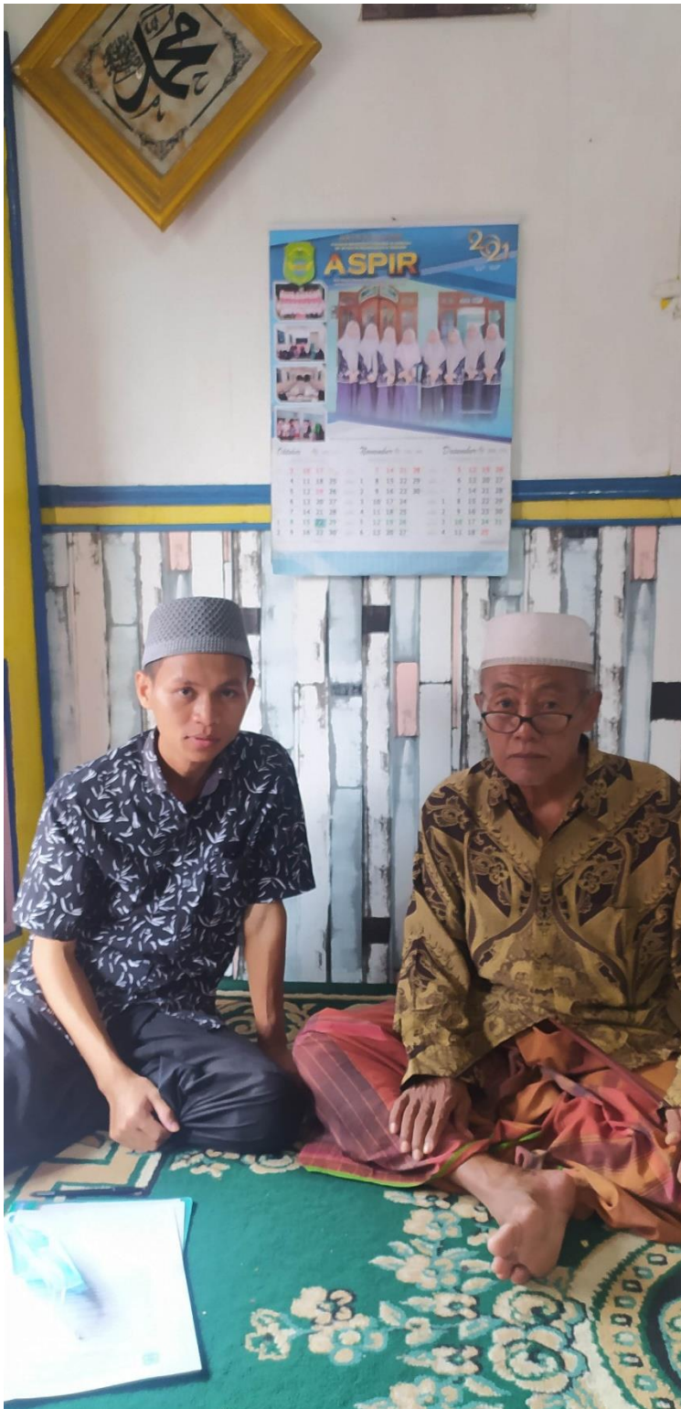
Foto Bersama Ketua Yayasan