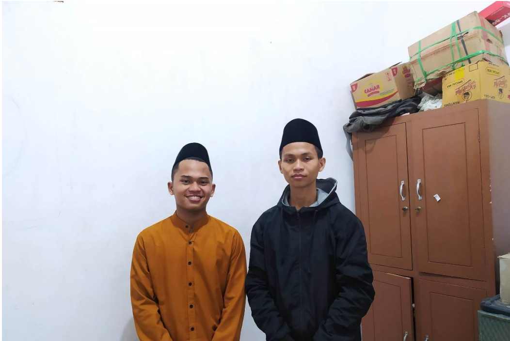
Foto bersama keamanan pondok