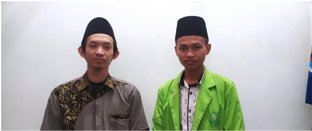
Foto bersama Bendahara pondok