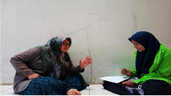
المقابلة مع الأستاذة