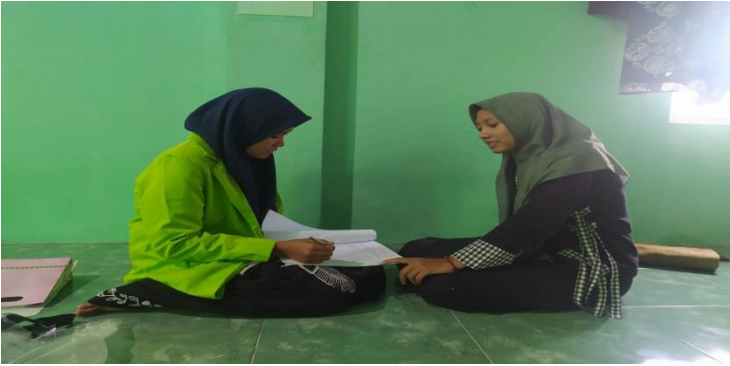
المقابلة مع الطالبات