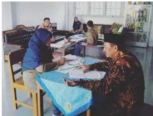
(Gambar 4.2 Percakapan pribadi kepala Madrasah dengan guru usai kunjungan kelas.)