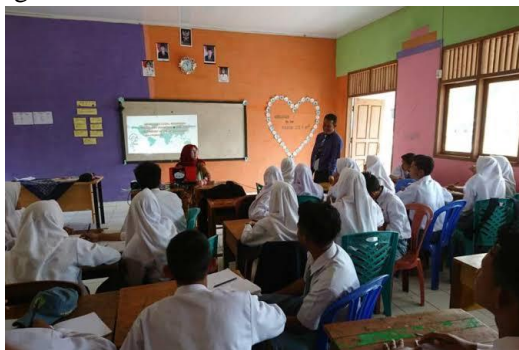
(Gambar 4.1 Teknik Supervisi Kunjungan Kelas Kepala MA Uswatun Hasanah. )

Dalam kunjungan kelas pertama , kepala madrasah melakukan pemeriksaan terhadap RPP. Pemeriksaan RPP dilakukan setiap awal semester dan ahir semester, dengan cara dikumpulkan RPP nya apabila terdapat kekurangan kepala madrasah memberitahu kepada guru yang bersangkutan. Pemeriksaan dilakukan agar dalam memberi pembelajaran guru tidak salah, dan sesuai dengan silabus yang dibagikan. 59 Dalam observasi pemeriksaan RPP ditemukan beberapa masalah terkait penerapan RPP, dikarenakan peserta didik ada yang tidak paham, sehingga pembelajaran dilakukan sesuai dengan situasi dan sesuai dengan kebutuhan peserta didik.