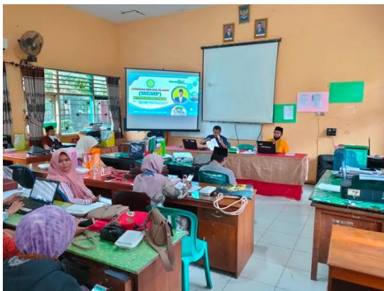
(Gambar 4.3 MGMP, Mendesain proses pembelajaran dimasa pandemi covid-19, yang variatif dan tidak membosankan.)

guru dalam menciptakan kreasi dan inovasi saat mengajar. 62