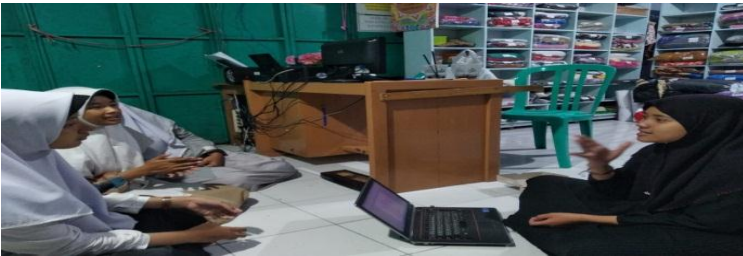
المقابلة بقسم اللغة معهد دار الأمانة