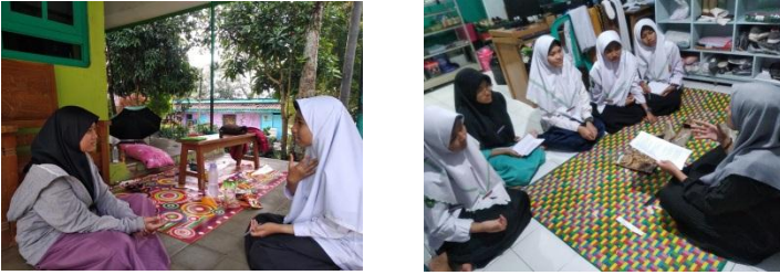
المقابلة بالطالبات معهد دار الأمانة