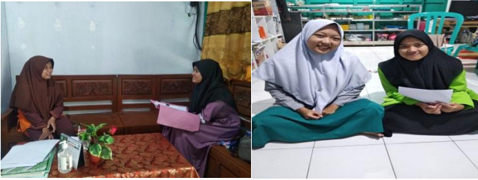
المقابلة بمشرفة اللغة