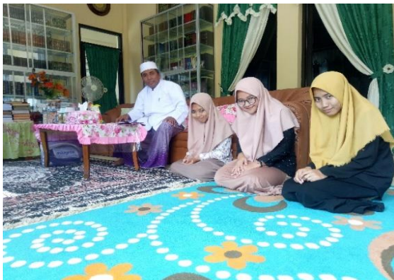
الملحق ٨: المعهد فضل الفضلان الإسلامي مييجين سمارنج