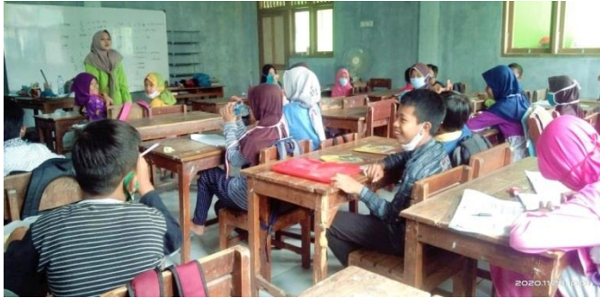
Uji Coba Angket