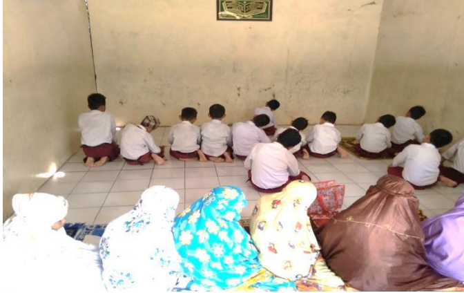
Kegiatan Shalat Dhuha Berjama'ah