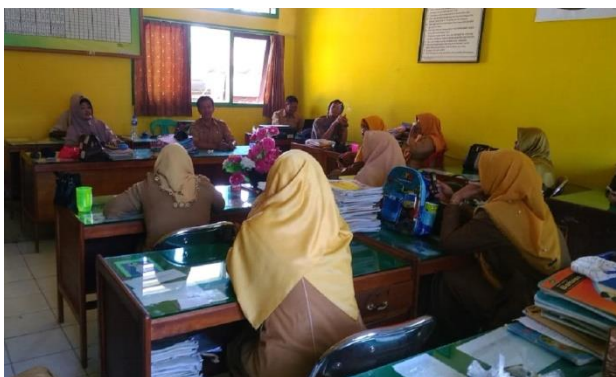
Gambar 4.1. Rapat Koordinasi

Berdasarkan keterangan hasil wawancara diatas dikuatkan dengan hasil observasi bahwa pembagian kepanitiaan ujian sekolah dengan melibatkan seluruh warga sekolah. Terlebih dahulu sekolah mengadakan rapat untuk pembentukan kepanitiaan ujian sekolah yang meliputi penanggungjawab, ketua, sekretaris, bendahara, dan anggota. Hal ini dapat diperkuat dengan hasil dokumentasi berupa foto kegiatan rapat koordinasi.