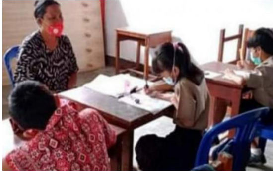
Gambar 4.4. Foto Kegiatan Bimbel/Les

Dari hasil wawancara, observasi, dan dokumentasi, peneliti menyimpulkan bahwa untuk meningkatkan mutu pendidikan dengan menciptakan lulusan yang baik sekolah mengadakan bimbel/les untuk siswa-siswi kelas 6 agar mendapatkan tambahan belajar diluar jam sekolah. Kegiatan bimbel dilakukan untuk persiapan ujian sekolah. Dalam kegiatan ujian sekolah, untuk soal dibuat sekolah itu sendiri mulai dari pembuatan kisi, soal, kunci jawaban, sampai koreksi dibuat oleh guru.