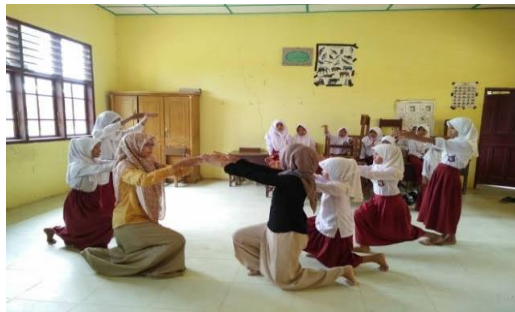
Gambar 4.3. Foto Latihan Lomba

Dari hasil wawancara dikuatkan dengan hasil observasi bahwa pelaksanaan pelatihan lomba dilakukan dua atau tiga kali dalam seminggu sampai gladi pelaksanaan lomba. Hal ini dapat diperkuat dengan hasil dokumentasi berupa foto kegiatan latihan lomba.