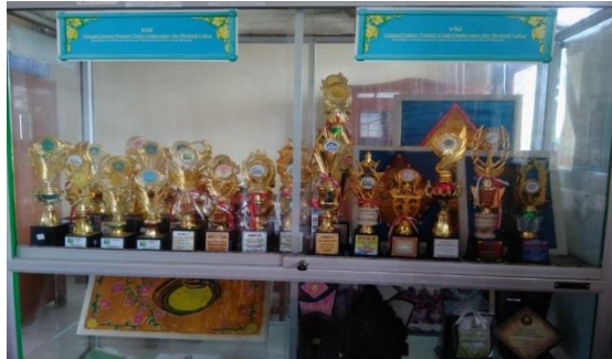
Gambar 4.5. Foto Piala Kejuaraan

dikuatkan dengan hasil dokumentasi berupa foto piala kejuaraan.