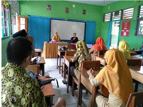
Gambar 4.2. Rapat Sekolah

Berdasarkan hasil observasi, wawancara, dan dokumentasi, peneliti menyimpulkan bahwa perencanaan sekolah dilakukan dengan rapat. Kegiatan rapat dengan melibatkan warga sekolah seperti kepala sekolah, guru, dan karyawan.