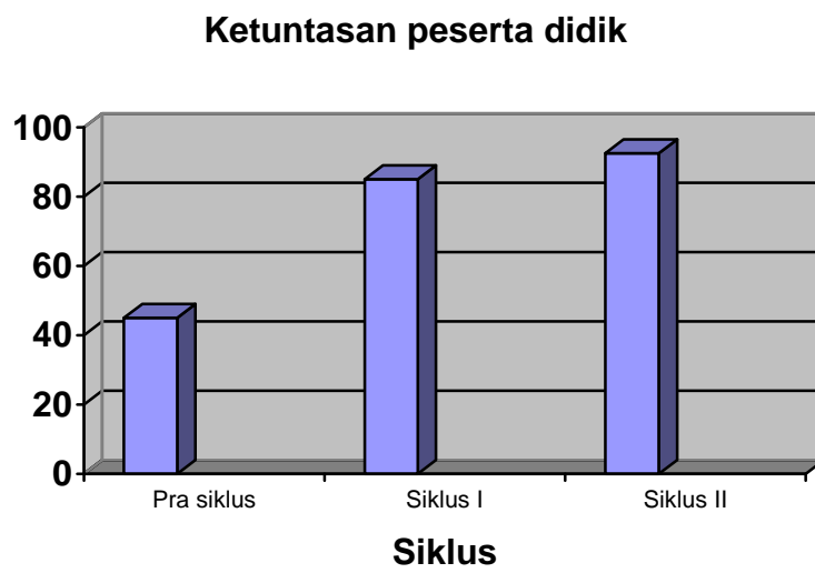
Gambar 4.3 Histogram Ketuntasan Peserta Didik