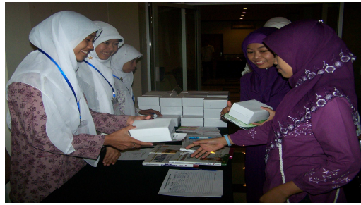
Pendaftaran dalam seminar 100 hari menuju baitullah, sebelum pelaksanaan Riyadhah Umrah dan Haji