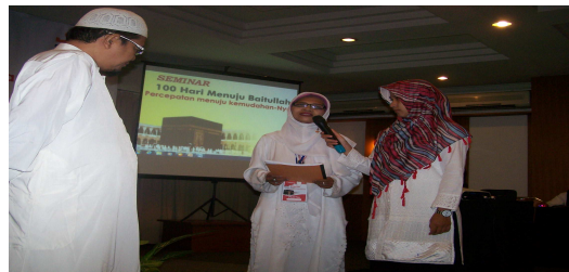
Seorang jamaah dipandu dengan petugas pelaksana dan seorang ustaz, dimana jamaah menyampaikan permasalahan yang tengah dihadapinya untuk mencari solusi bersama.