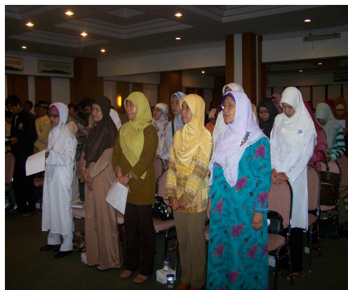
Peserta dalam Seminar 100 hari menuju baitullah sebelum pelaksanaan Riyadhah Umrah dan Haji.