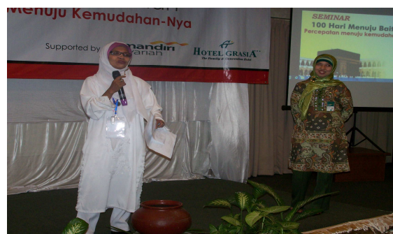
Seorang peserta Jamaah alumni Riyadhah sedang menyampaikan pengalaman spiritualnya