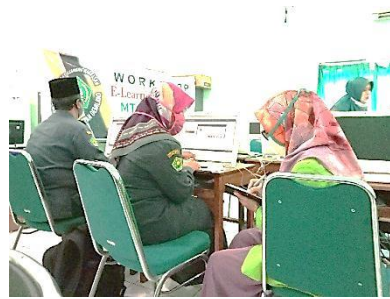
المقابلة مع معلم اللغة العربية