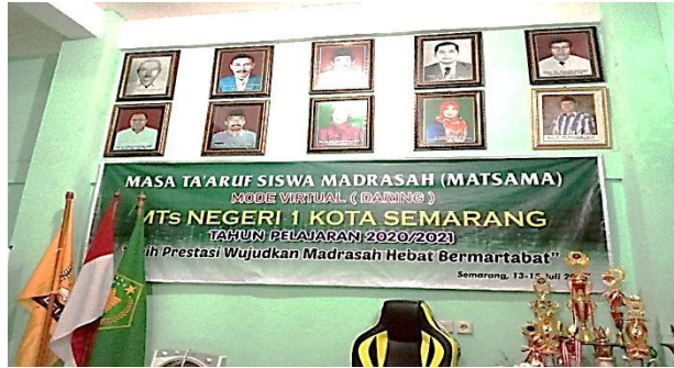
مدير مدرسة المدرسة المتوسطة الإسلامية الحكومية واحد سمارنج. في سيمارانج من عام