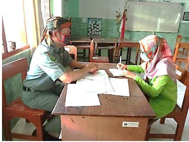
المقابلة مع نائب المناهج