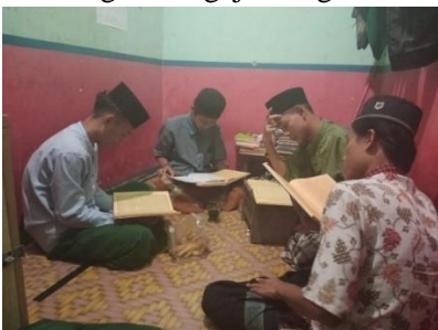
Foto kegiatan ngaji sorogan