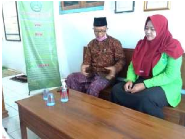
Izin penelitian sekaligus rapat kordinasi dengan kepala sekolah dan wali kelas