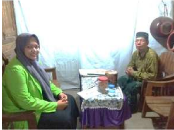
Wawancara dengan guru pengampu mata pelajaran bulughul marom kelas 8