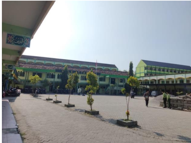
تصوير المدرسة العالمية الإسلامية التنوير بوجونيكور من الداخل