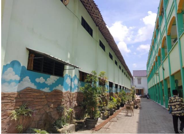
تصوير قاعة التنوير من الورااء