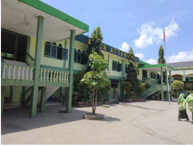
تصوير قاعة التنوير من الأمام