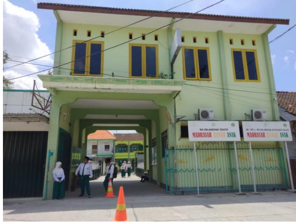
تصوير المدرسة العالمية الإسلامية التنوير بوجونيكور من الخارج