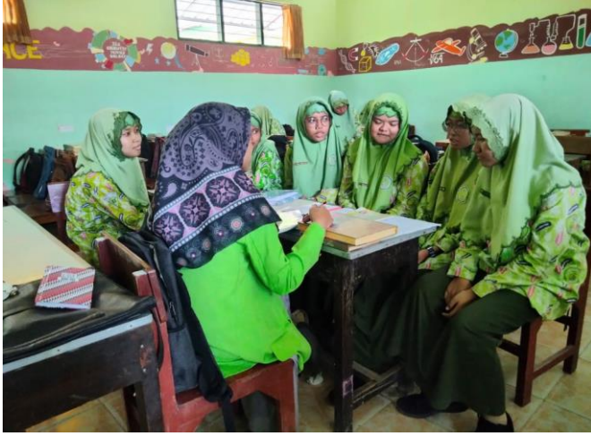
المقابلة مع التلميذات