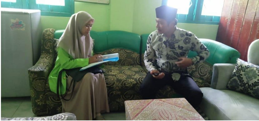
المقابلة مع رئيس المدرسة العالية الإسلامية التنوير