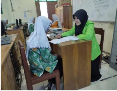
اختبار مهارة القراءة