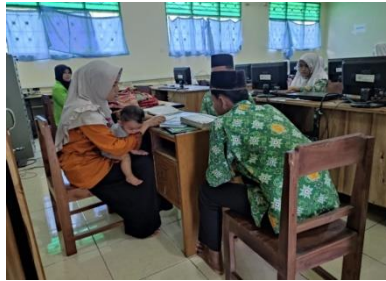
اختبار انجاز تحفيظ القران