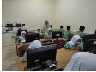
عملية تحفيظ القران