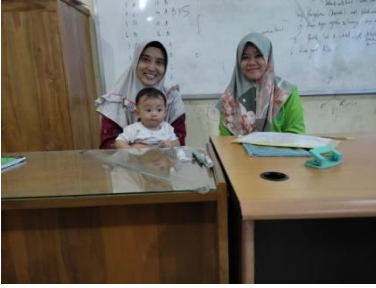
صورة مع مدرسة تحفيظ