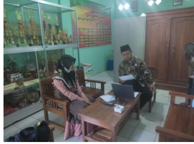
المقابلة مع رئيس المدرسة