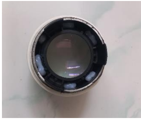
Gambar : Fotocopy Lens