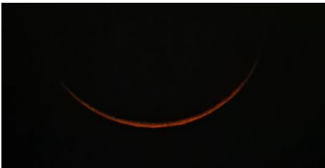
Gambar : Hasil Praktik Pertama Rukyatul Hilal Teleskop pabrikan dan Teleskop handmade