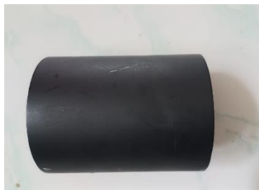
Gambar : Baffle

Baffle merupakan bagian terdepan (ujung tabung lensa objektif) pada Teleskop refraktor dan berfungsi sebagai peredam agar cahaya liar tidak masuk pada lensa objektif. 11 serta mengurangi fluks cahaya yang masuk ke Teleskop dari berbagai arah dan dapat meningkatkan kontras cahaya Bulan sabit. 102