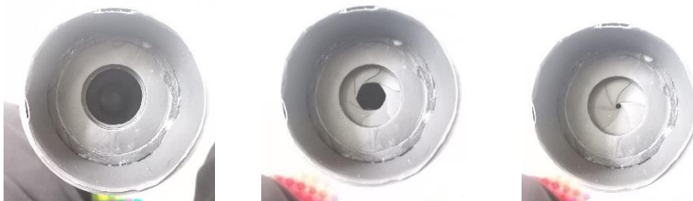
Gambar : Diafragma

Diafragma ini terletak di dalam tabung Teleskop dan merupakan bagian penting pada tabung Teleskop karena mampu untuk meminimalisir patulan cahaya liar yang masuk dari lensa objektif 104 untuk dibiaskan ke lensa mata ( eyepiece )