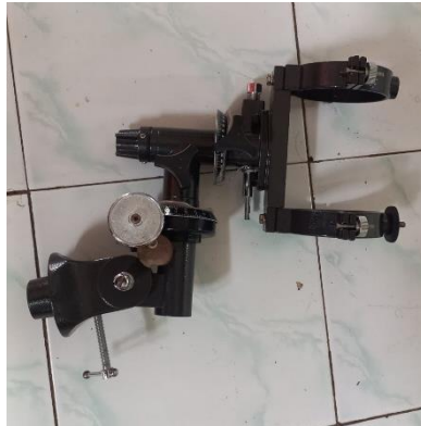
Gambar : Mounting Equatorial manual

Mounting merupakan sistem utama sebagai penggerak teleskop, oleh sebab itu mounting sangat berpengaruh pada posisi objek (Hilal) maka di butuhkan mounting yang akurat dan presisi, dengan memiliki skala derajat altitude dan azimuth (jika jenis mounting Alt-Azimuth ), karena dalam hal ini yang di rukyat adalah Hilal, dimana kondisi Bulan itu tidak terlihat sehingga dibutuhkan skala derajat agar teleskop bisa di arahkan ke posisi Hilal. 6