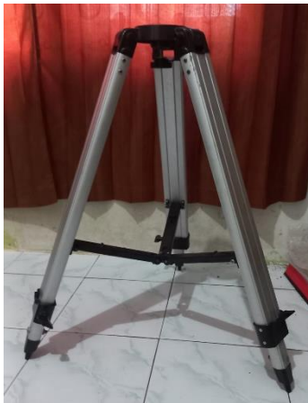
Gambar : Tripod

Tripod merupakan kaki untuk berpijaknya Teleskop diatas suatu permukaan. Tripod ini sangat berpengaruh pada permukaan tanah sehingga ketika melakukan rukyatul Hilal diharapkan memakai tripod yang bisa diatur kedatarannya agar lebih maksimal dan akurat dalam pengamatan benda langit.