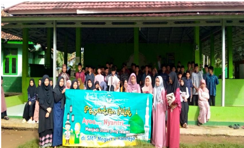
Gambar 7. Profil Masjid SMPN 2 Kalirejo Lam-Teng