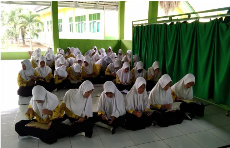
Gambar 10 . Siswa Setoran surat pendek