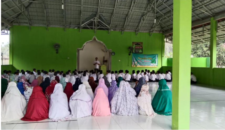
Gambar 9 . Ekstra Kulikuler ROHIS