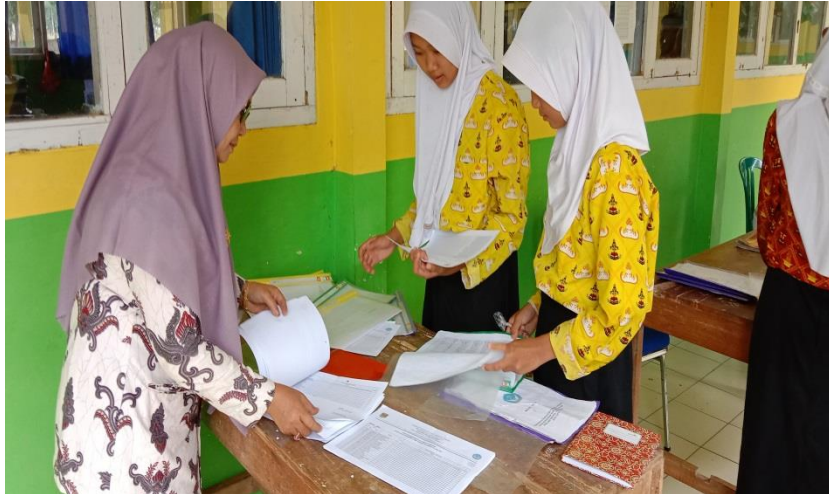
Gambar 6. Siswa/Siswi Melakukan Absensi Sholat Berjamaah