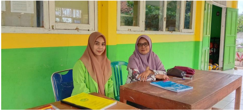
Gambar 2. Wawancara dengan Guru Pendidikan Agama Islam