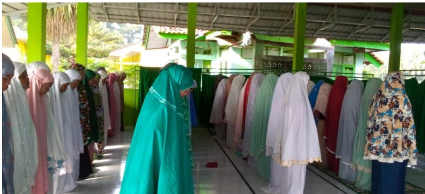
Gambar 8. Siswa /Siswa Saat Sholat Dzuhur Berjamaah