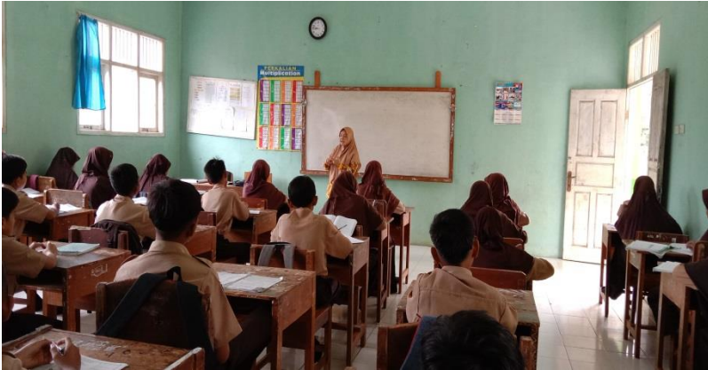
Gambar 4. Guru pendidikan Agama Islam Saat Mengajar