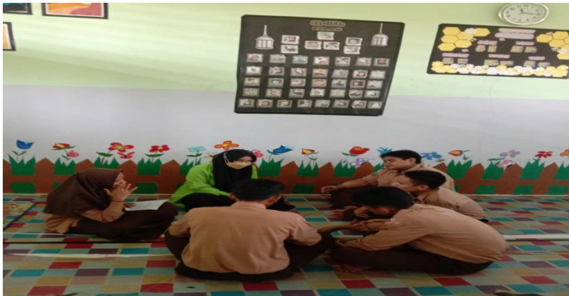
Gambar 3. Wawancara dengan Siswa SMPN 2 Kalirejo Lampung Tengah