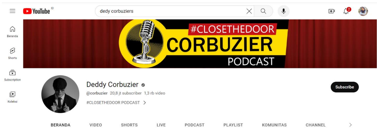
Gambar 1 Tangkapan Layar kanal youtube dedy corbuzier

Nama Kanal : Deddy Corbuzier Bergabung : 8 Desember 2009 Lokasi : Indonesia Ditonton : 5.036.684.850