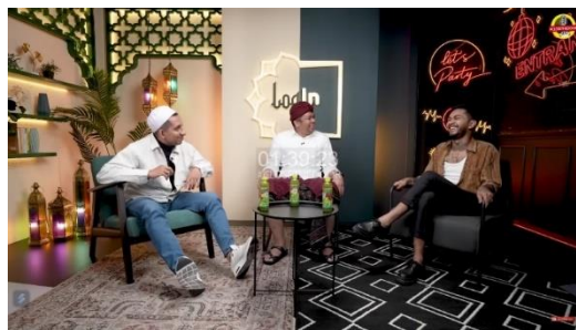
Tabel 3 4