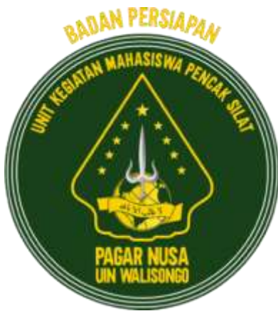
Logo UKM PSPN UIN Walisongo