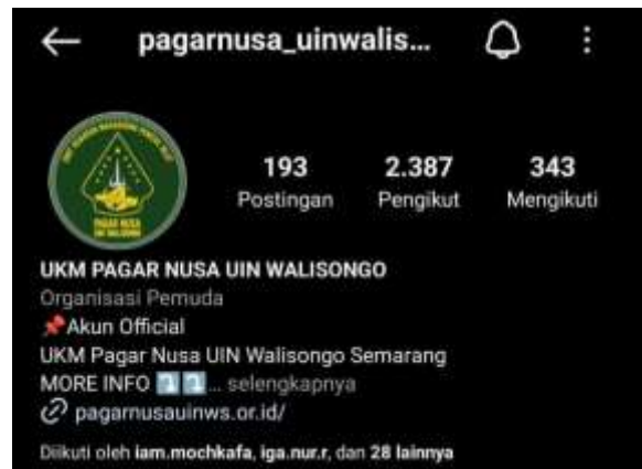
Akun Instagram UKM PSPN UIN Walisongo