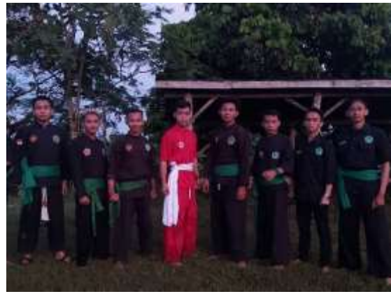
Dokumentasi Kegiatan UKM PSPN UIN Walisongo