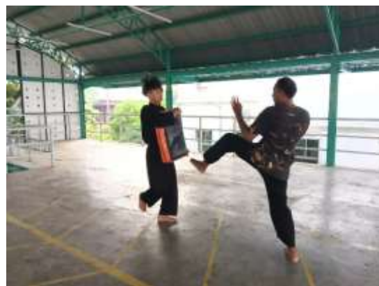
Dokumentasi Kegiatan UKM PSPN UIN Walisongo