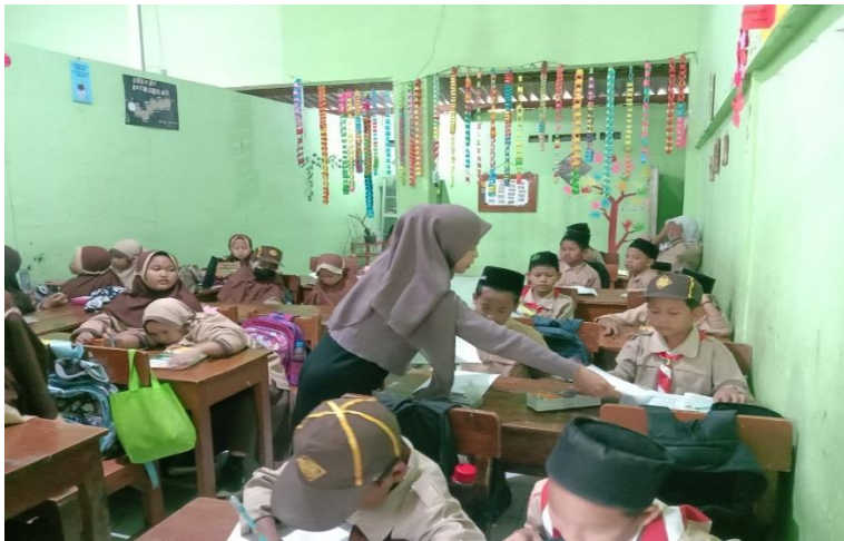
Proses Penyebaran Angket Penelitian