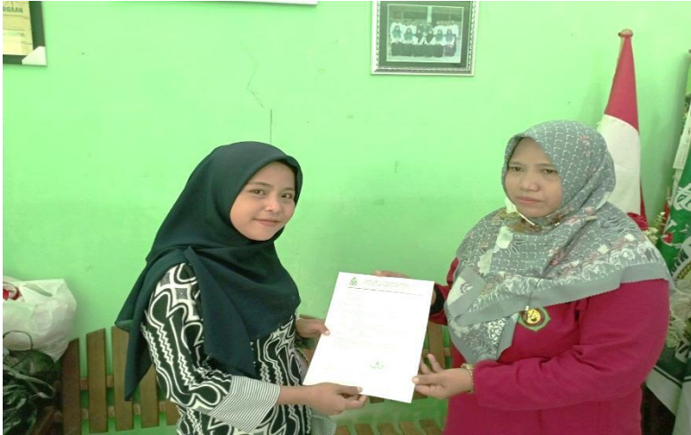
Foto Peneliti dengan Guru Kelas