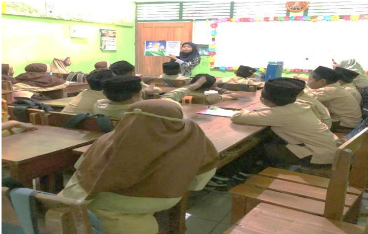
Pembelajaran Dengan Media Big Book pada Kelas Eksperimen