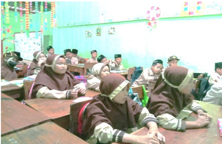
Pembelajaran Tanpa Media pada Kelas Kontrol