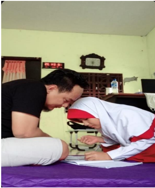
Orang Tua Menemani Belajar pada Anak