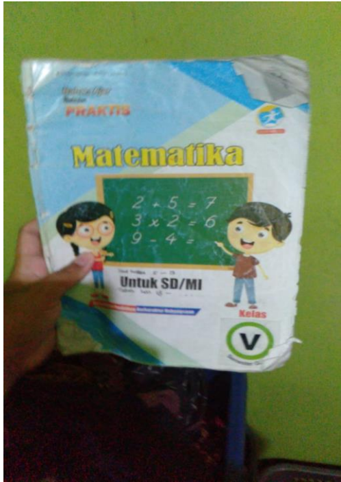
Buku Tambahan Anak saat di Rumah