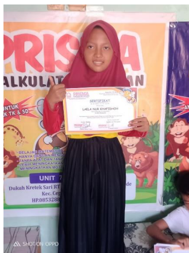
(Gambar 4. Memberikan Les Prisma)