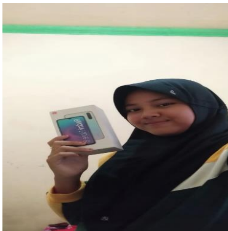
(Gambar 3. Pemberian Hadiah Smartphone)