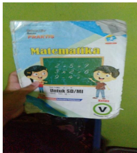
(Gambar 5. Memberikan Buku Matematika)