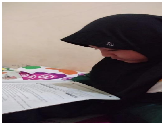
(Gambar 6. Memberikan Buku serta Rumah Nyaman)

mengerjakan tugas sekolah, pada kelompok 2 dari ke 5 anak yang mendapatkan peringkat sedang, dari hasil wawancara rata-rata orang tua hampir semua mengatakan bahwa 1) pemberian fasilitas belajar berupa buku pelajaran, buku, hitung-hitungan, hp untuk kebutuhan belajar pada saat pelajaran daring, 2) pemberian fasilitas belajar berupa menyekolahkan sekolah MDA, ruangan yang nyaman, 3) pemberian fasilitas belajar berupa meja belajar, 4) pemberian fasilitas belajar berupa uang untuk membeli bolpen dan 5) pemberian fasilitas belajar berupa uang jajan sebagai kebutuhan tubuh agar semangat belajar, 6) pemberian fasilitas belajar berupa les bola seminggu sekali.