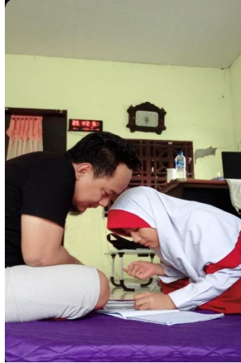
(Gambar 1. Orang Tua Menemani Belajar pada Anak)