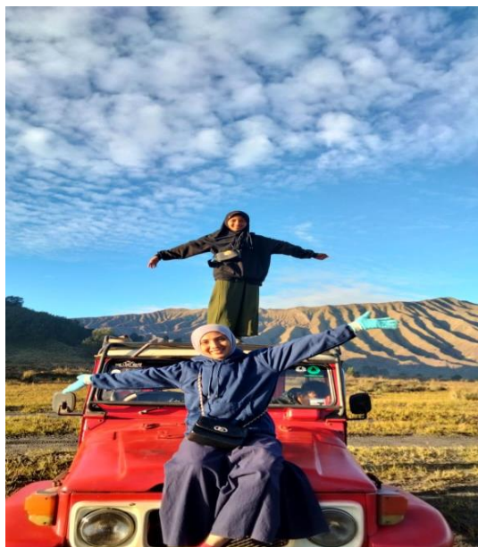
(Gambar 2. Pemberian Hadiah Berkunjung ke Tempat Wisata)