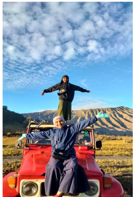
Liburan di Gunung Bromo