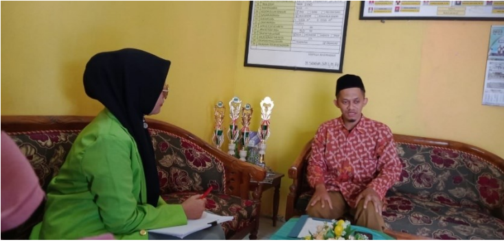
المقابلة مع مدرس اللغة العربية المدرسة الثانوية مفتاح السعادة مجين سمراڤ