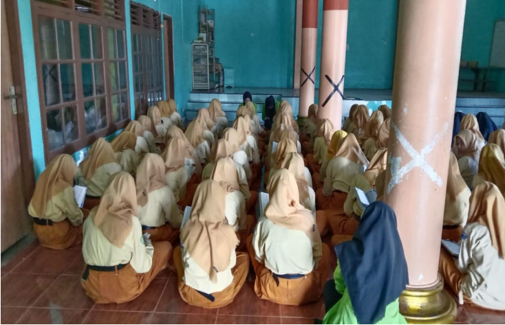
ملاحظة في المدرسة الثانوية مفتاح السعادة مجين سمارانج