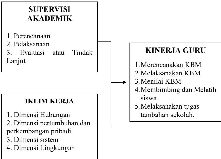
Tabel 2.1 Kerangka Berfikir