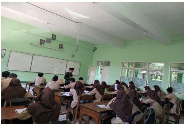
FOTO KELAS EKSPERIMEN