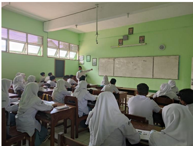
FOTO KELAS EKSPERIMEN