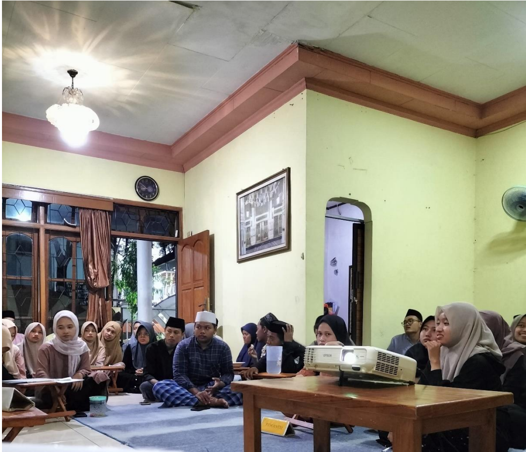
(kegiatan musyawarah kitab kuning)