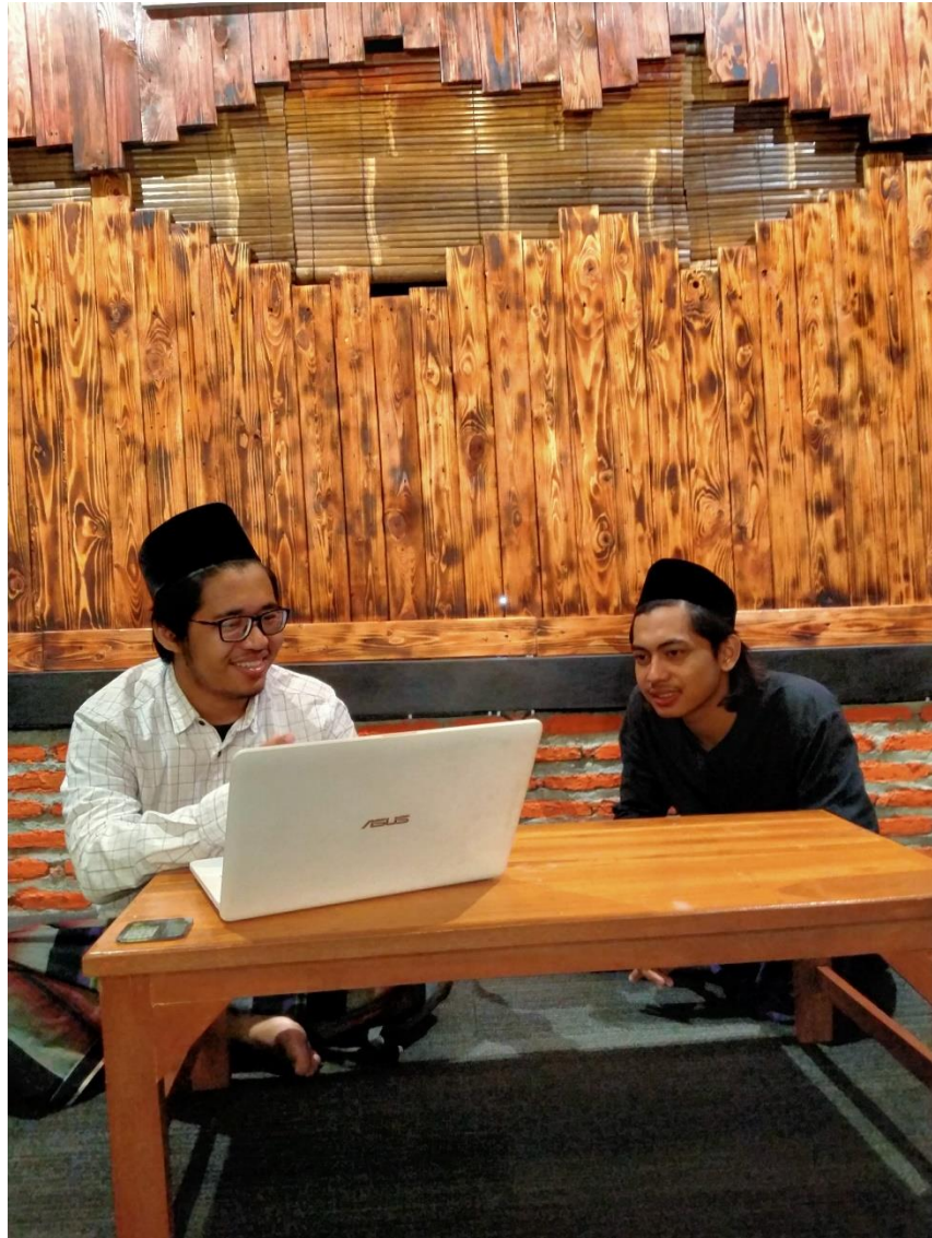
(wawancara bersama Ustadz Syamsul sebagai dewan asatidz)