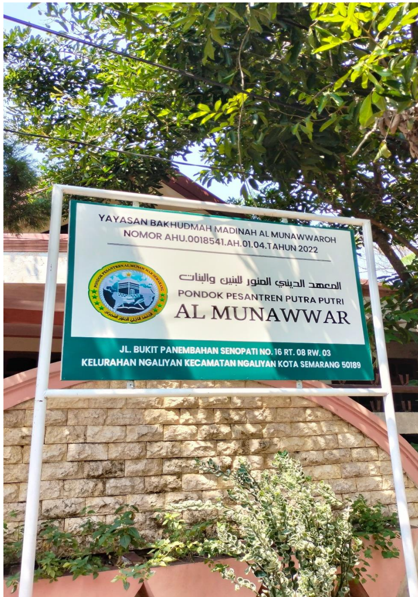
(Plang Pondok Pesantren Al-Munawwar Karonsih Semarang)