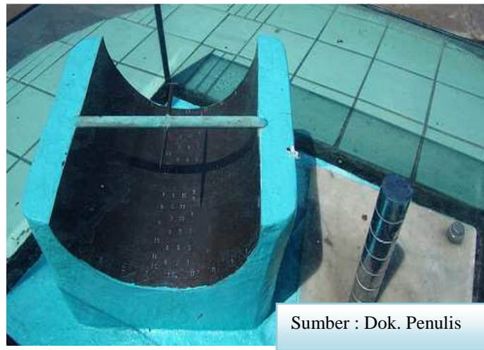
Gambar 1. 1