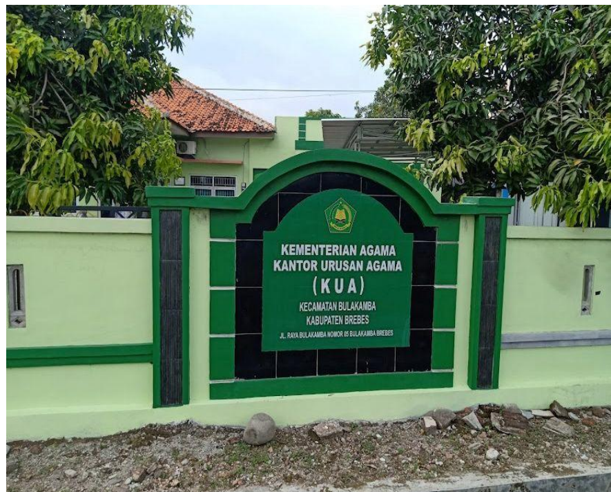
GAMBAR 1 KUA Bulakamba Brebes