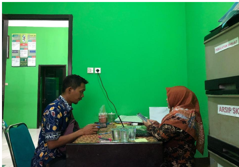
GAMBAR 4 NARASUMBER

Kegiatan Binwin tidak hanya melibatkan pihak internal KUA, tetapi juga bekerja sama dengan berbagai instansi dan tenaga profesional yang memiliki kompetensi dalam bidang keluarga.