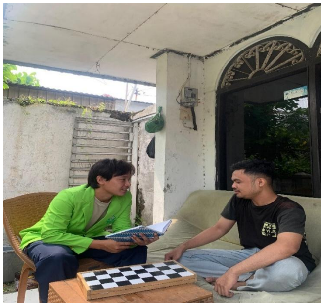
GAMBAR 6 Wawancara suami

BDZ juga menambahkan bahwa program Bimbingan Perkawinan Keluarga Sakinah memberikan dampak positif dalam mempersiapkan kehidupan rumah tangga. Ia menilai bahwa sejak awal, program ini memang dimaksudkan untuk membekali pasangan yang akan menikah agar memiliki pemahaman dan kesiapan mental yang baik. Dengan mengikuti bimbingan ini, pasangan dapat lebih siap menghadapi tantangan pernikahan serta menghindari potensi kekerasan dan gangguan terhadap keutuhan rumah tangga.