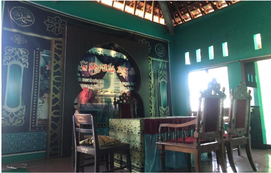
GAMBAR 5 Ruang Pelaksanaan

Setelah kegiatan selesai, peserta akan memperoleh sertifikat sebagai bukti telah mengikuti bimbingan. Sertifikat ini menjadi syarat tambahan dalam proses pencatatan nikah, meskipun bukan merupakan keharusan administrative