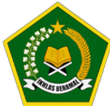
GAMBAR 2 Logo KUA

Kantor Urusan Agama (KUA) memiliki lambang berbentuk segi lima sama sisi. Isi lambang Kementerian Agama adalah sebagai berikut: