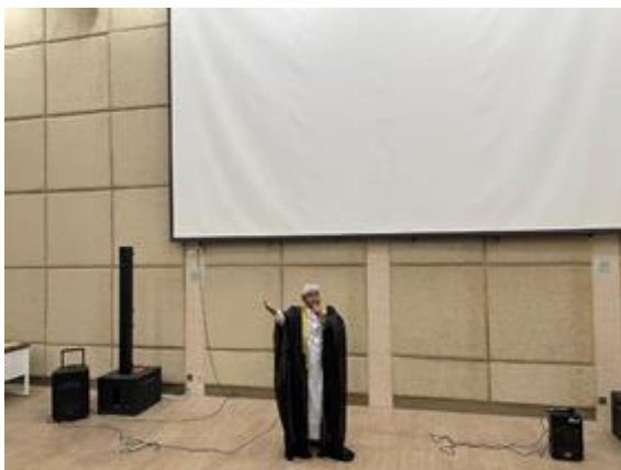
المشاهدة في مسابقة الصحراء