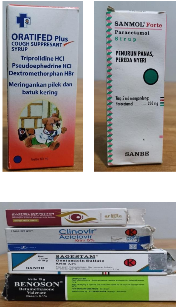
Produk Obat Tidak Bersertifikat Halal

Adapun obat-obat yang ditemukan penulis dari jual beli obat pada Apotek tersebut sebagai berikut.