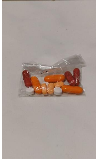
Sampel obat-obat yang diperjualkan