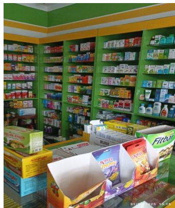
Obat-obat yang ada di Apotek K24 Satelit