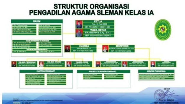
Gambar.2.1 Struktur Organisasi Pengadilan Agama Sleman 4