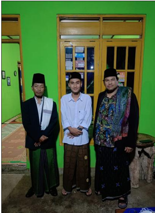
sekaligus tokoh agama