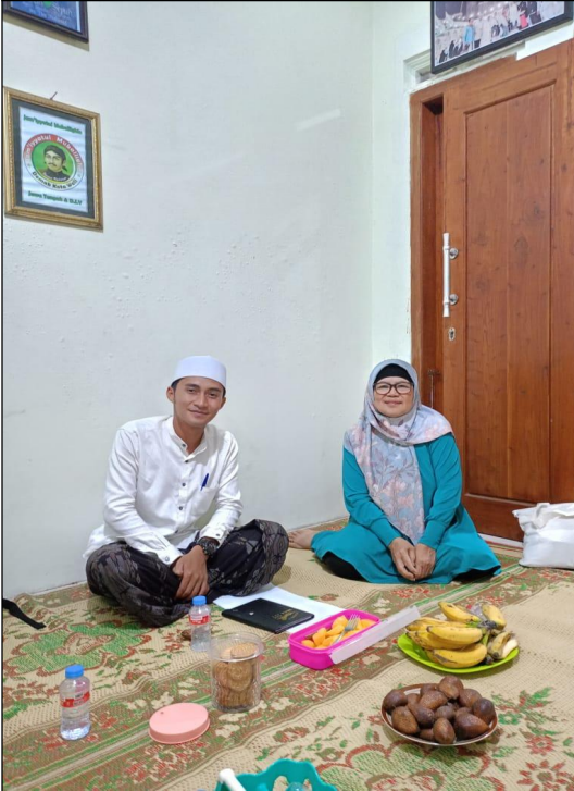
Wawancara Kelompok Binaan