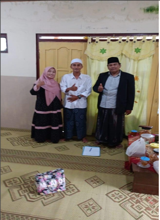
Wawancara kelompok binaan