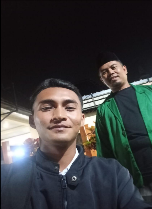
Wawancara Kelompok Binaan