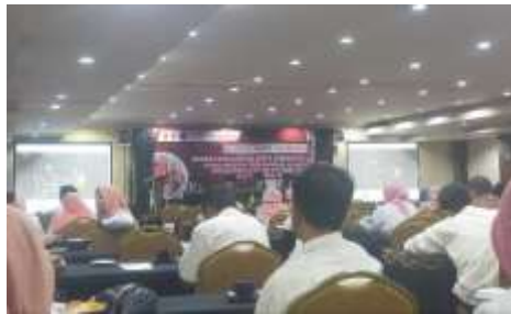
Gambar 4.9 Perwakilan Guru Mengikuti Diskusi yang Dilaksanakan oleh Pemerintah Kota Semarang

Kalau sesama guru itu 3 bulan sekali ada perkumpulan pertemuan kita sharing tentang program kegiatan yang belum terlaksana, tentang pembelajaran. Juga mengikuti workshop dan sharing tentang ilmu yang didapat selama mengikuti workshop, kemudian mengadakan penilaian kinerja guru, diskusi bersama, saling tukar dan berbagi ilmu. 12