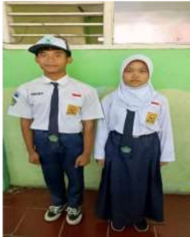
Gambar 4. 1 Seragam Hari Senin dan Selasa