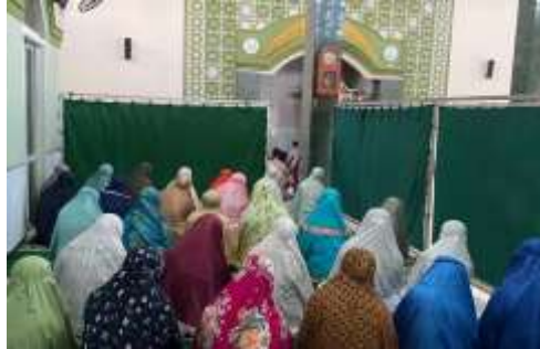
Gambar 4.8 Kegiatan Sholat Dzuhur Berjamaah

memberi contoh yang baik untuk anak-anak agar dapat ditiru dengan baik. 11