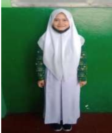
Gambar 4. 2 Seragam Hari Rabu dan Kamis