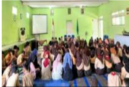
Gambar 4.11 Peringatan Maulid Nabi Muhammad SAW

ulama yang kharismatik, dengan harapan agar siswa-siswi dapat mengembangkan kegiatan keagamaan 3 hal tadi. 24