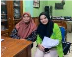
Wawancara dengan kepala sekolah