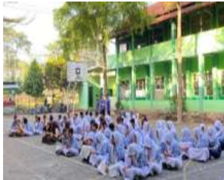
Gambar 4.12 Pembiasaan Yasin dan Tahlil Bersama

Kalau pembiasaan disini diurutkan dari pagi itu membaca doa bersama sebelum masuk kelas, terus sholat dhuhur berjamaah bersama di masjid, terus kalau hari jum'at itu ada kegiatan membaca yasin dan tahlil bersama dilanjut berinfanq seikhlasnya. Kalau yang lain itu selalu senyum dan salam jika bertemu dengan guru atau sesama teman, setiap pelajaran agama pasti tadarus Al Qur'an bersama. 26