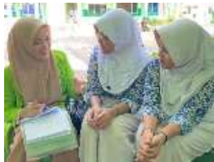
Wawancara Dengan Ketua Dan Wakil OSIS