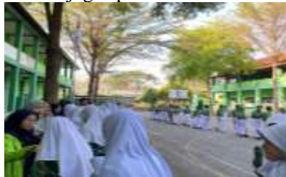
Gambar 4. 5 Pembiasaan Pagi dan Dilanjutkan dengan Budaya Senyum, Salam, Sapa

dari sekolah pada umumnya. Meskipun SMP Hasanuddin 6 ini berbasis islami, apabila ada non muslim yang mau masuk itu kita menerima di sekolah ini. Selain itu sekolah ini sebelum memulai jam pelajaran akan melakukan pembiasaan spiritual berupa doa bersama jam 06.45 dengan membaca Al-fatikhah, Asmaul Husna, Sholawat Nariyah, kemudian kalau hari jum'at membaca tahlil bersama dengan harapan agar lulusan SMP Hasanuddin seenggaknya bisa tahlil. Jadi itulah kelebihan dari kita juga usaha-usaha yang dapat kita laksanakan untuk menjaga spiritualitas sekolah. 3