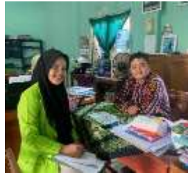
Wawancara dengan Waka Kesiswaan