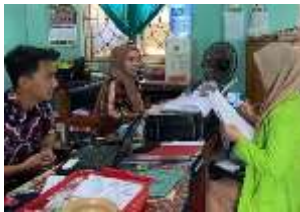
Wawancara dengan Staff TU