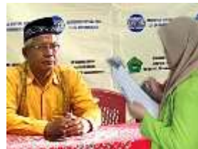
Wawancara Dengan Waka Kurikulum