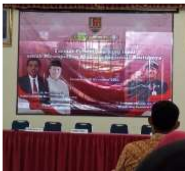
Gambar 4.6 Perwakilan Guru Mengikuti Seminar Pendidikan

Lebih lanjut Ibu Lestari menjabarkan mengenai usaha untuk mengembangkan budaya organisasi sekolah mengatakan: