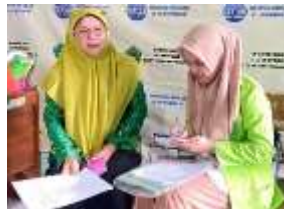
Wawancara dengan pembina OSIS