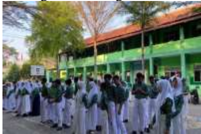
Gambar 4.10 Pembiasaan Doa dan Asmaul Husna

Komitmen yang kami lakukan untuk sekolah dalam mengembangkan budaya organisasi di SMP Hasanuddin 6 Semarang melakukan pembiasaan positif seperti kegiatan apel pagi dan membaca doa bersama, melaksanakan program keagamaan rutin seperti tadarus Al Qur'an, dan melakukan evaluasi bulanan. Selain itu, disini juga memprioritaskan komunikasi yang baik yang terbuka, belajar disiplin untuk berangkat sebelum jam 7 dan melakukan doa bersama di lapangan, dan memberi penghargaan untuk setiap warga sekolah yang misalnya menang dalam mengikuti lomba. 14