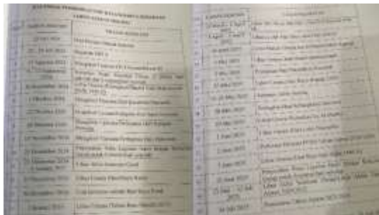
Gambar 4. 4 Kalender Pendidikan SMP Hasanuddin 6 Semarang