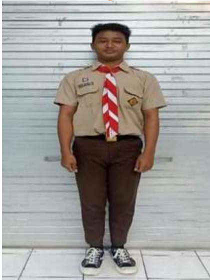
Gambar4. 3 Seragam Hari Sabtu