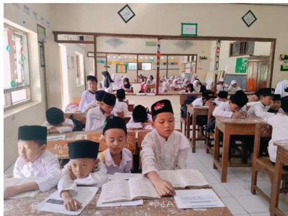
Gambar 5.3 Membaca Al-quran

Didalam pembelajaran, pihak sekolah juga membuat jadwal ngaji dalam kelas, dan diampu langsung dengan ustadzah khusus ngaji, dengan ini diharapkan sekolah dapat membantu siswa untuk mempelajari cara membaca Al-Qur'an dengan tepat dan benar.