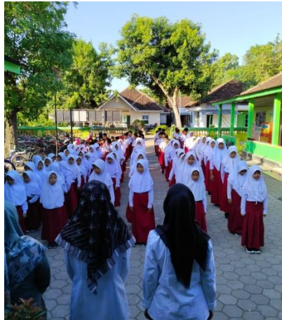
Gambar 2.3 Membaca Asmaul Khusna

Para guru di MI NU 13 Gebanganom Wetan berperan aktif dalam melaksanakan pendidikan karakter religius. Mereka tidak hanya mengajarkan materi agama, tetapi juga memberikan contoh konkret dan menciptakan lingkungan belajar yang mendukung pertumbuhan spiritual siswa. Melalui