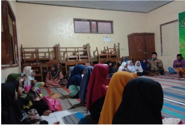
Gambar: Kegiatan Pesantren Ramadhan