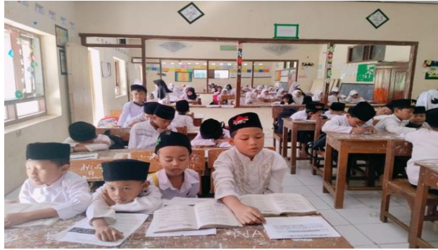
Gambar 2.2 Ngaji Al-Qur'an