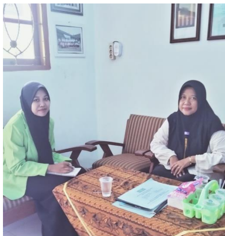
Gambar: Wawancara dengan guru di MI NU 13 Gebanganom Wetan