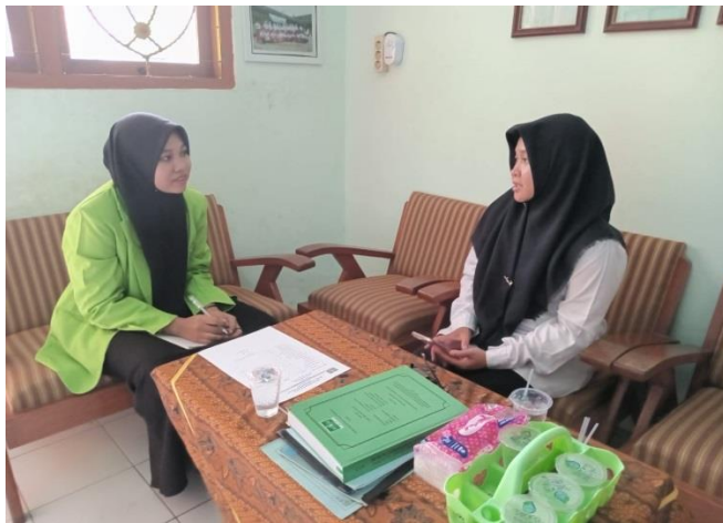
Gambar: Wawancara dengan Kepala Sekolah MI NU 13 Gebanganom Wetan