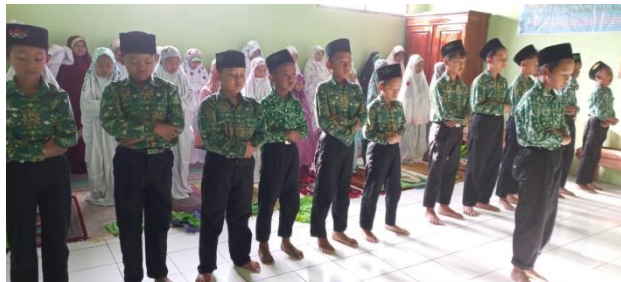
Gambar 2.1 Sholat Berjamaah

MI NU 13 Gebanganom Wetan telah melaksanakan yang menyeluruh dalam memperkuat pendidikan karakter religius berdasarkan wawancara dengan para guru. Sekolah ini tidak hanya berfokus pada kegiatan keagamaan formal, tetapi juga mengintegrasikan antara ilmu agama dan pembelajaran sehari-hari. Selain itu, kegiatan rutin seperti sholat berjamaah dan membaca Al-Qur'an menjadi elemen yang penting untuk membentuk karakter religius siswa.