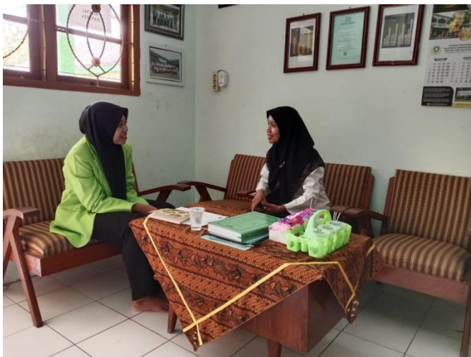
Gambar: Wawancara dengan guru di MI NU 13 Gebanganom Wetan