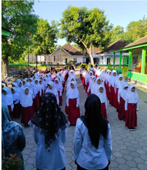
Gambar: Kegiatan Membaca Asmaul Khusna di Pagi Hari