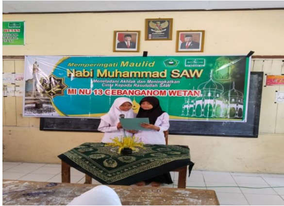
Gambar: Memperingati Maulid Nabi Muhammad SAW