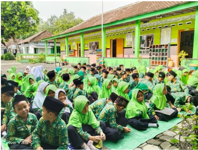
Gambar: Dzikir Pagi