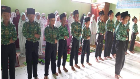
Gambar 5.2 Sholat berjamaah

Didalam pembelajaran, pihak sekolah juga membuat jadwal ngaji dalam kelas, dan diampu langsung dengan ustadzah khusus ngaji, dengan ini diharapkan sekolah dapat membantu siswa untuk mempelajari cara membaca Al-Qur'an dengan tepat dan benar.