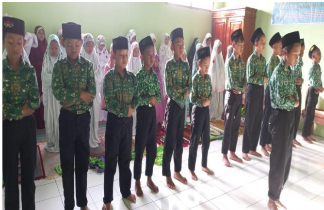
Gambar: Sholat Berjamaah