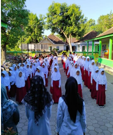
Gambar 5.1 Kegiatan membaca asmaul khusna dipagi hari

dhuhur berjamaah, dan berdo'a sebelum pulang. Dalam hal ini diharapkan dapat menjadikan siswa lebih baik kedepanya terutama dalam berakhlakul karimah.