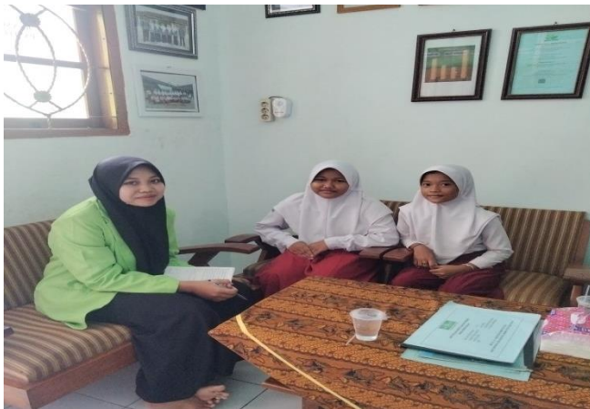
Gambar: Wawancara dengan siswa MI NU 13 Gebanganom Wetan