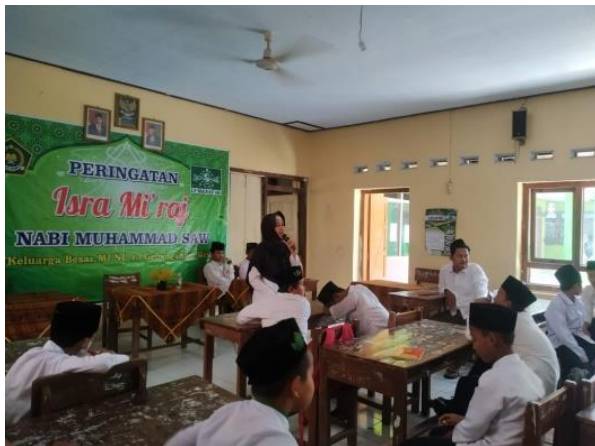
Gambar: Memperingati Isra Mi'raj Nabi Muhammad SAW