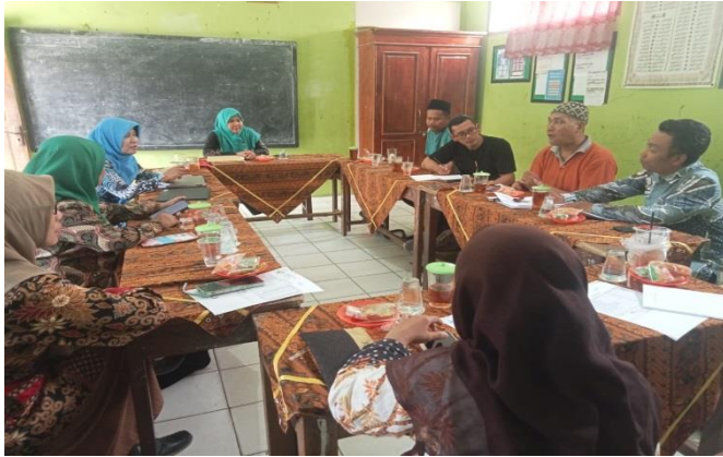
Gambar: Rapat Evaluasi Bulanan