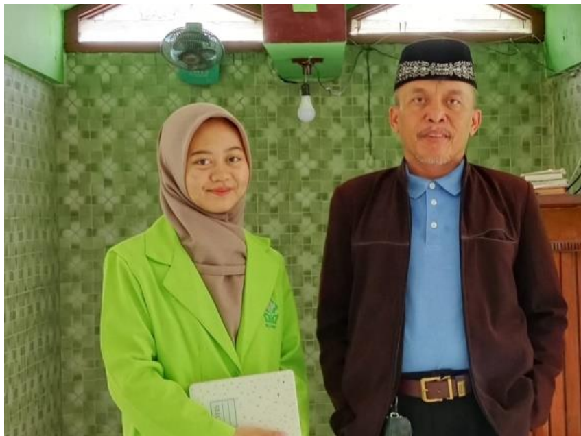
Gambar.3 Wawancara dengan Pekerja Sosial dan Pembimbing Agama dari Kemenag