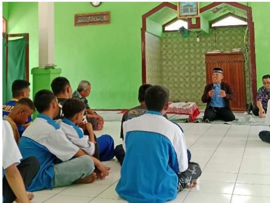
Gambar.2 Kegiatan Bimbingan Agama Islam