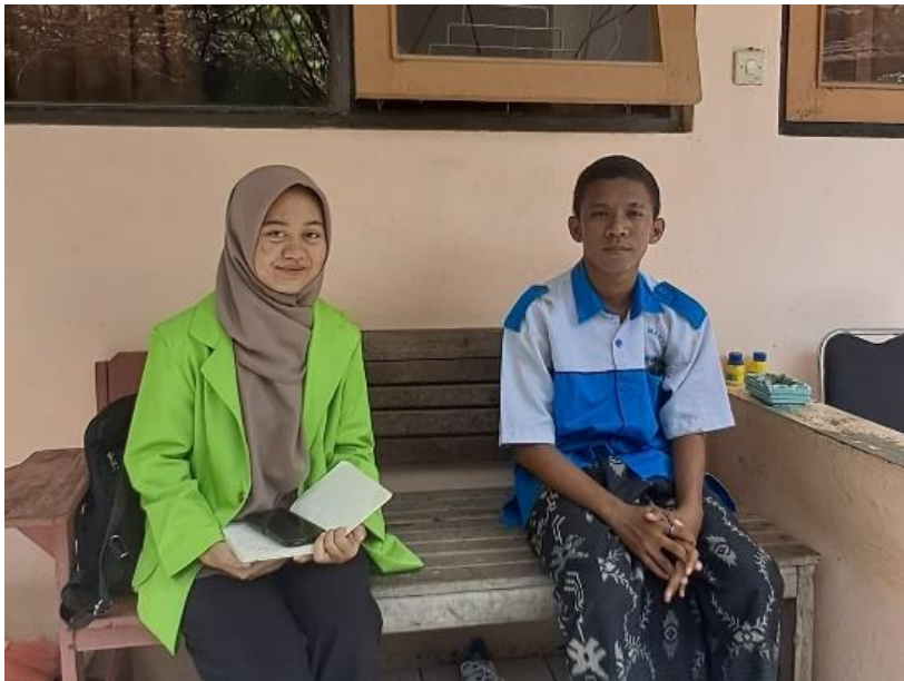
Gambar.4 Wawancara dengan Penerima Manfaat