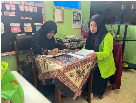
5. Wawancara dengan guru kelas II A