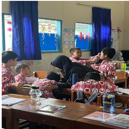
Gambar 4. 2 Kurangnya rasa percaya diri peserta didik

“Terdapat peserta didik yang kesulitan mengekspresikan perasaan dan pendapat secara jelas akibat kurangnya rasa percaya diri, serta terbatasnya kemampuan mendengarkan, yang pada akhirnya menghambat pemahaman mereka.” 8