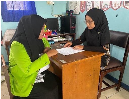
10. Wawancara dengan guru kelas V A