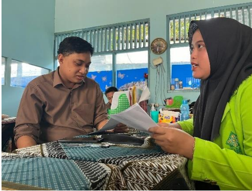
9. Wawancara dengan guru kelas IV A