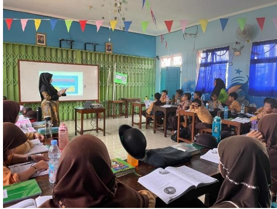
Gambar 4. 4 Inovasi dalam pembelajaran

Hal ini diperkuat dengan pernyataan hasil wawancara dan observasi dari yaitu ibu R4 selaku guru kelas II A, dan ibu R5 selaku guru kelas II B mengatakan bahwa: