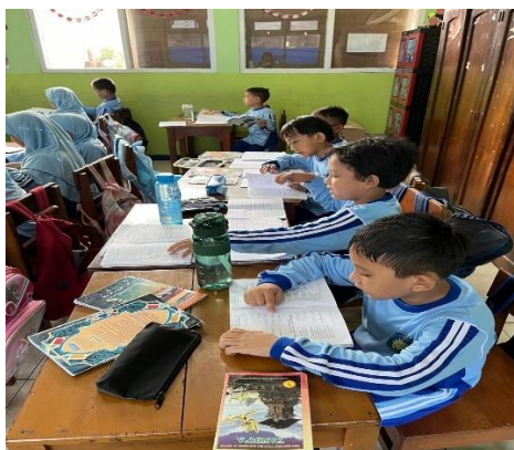
Gambar 4. 3 Kegiatan membaca bersama

“ Dalam rangka meningkatkan keterampilan berkomunikasi, sekolah menyediakan beberapa program, antara lain ekstrakurikuler tilawah dan English Club . Selain itu, keterampilan tersebut juga dapat dikembangkan melalui pembelajaran yang melibatkan kegiatan tanya jawab materi secara mandiri, membaca bergantian, diskusi, serta meningkatkan literasi melalui membaca buku bersama. Metode pembelajaran yang bervariasi, seperti diskusi atau permainan, juga mendukung pengembangan keterampilan komunikasi, karena di dalamnya terdapat interaksi antar peserta.” 14