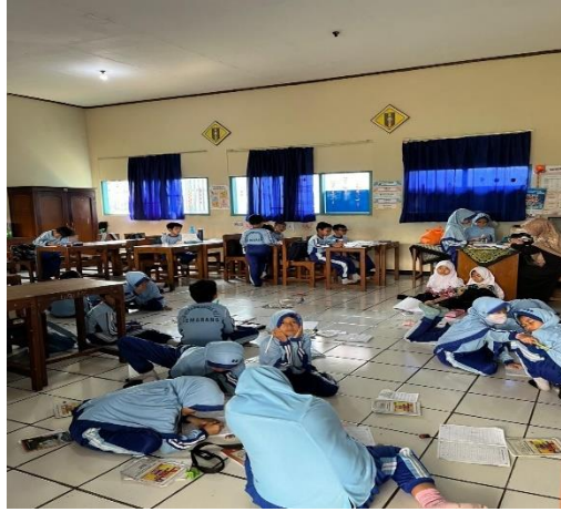
Gambar 4. 5 Kegiatan diskusi kelompok

Hal ini diperkuat dengan pernyataan dari yaitu bapak R6 selaku guru kelas III A, dan bapak R7, selaku guru kelas III B mengatakan bahwa: