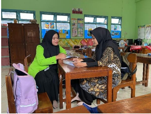
4. Wawancara dengan guru pendamping kelas 1 A