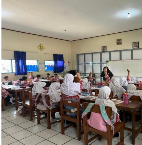
Gambar 4. 1 Keaktifan peserta didik

Hal ini diperkuat dengan pernyataan dari yaitu bapak R9, selaku guru kelas V A dan R10, selaku guru kelas V B, mengatakan bahwa: