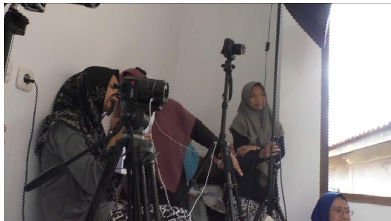
Gambar 11 proses take video konten channel YouTube @SirbinTV