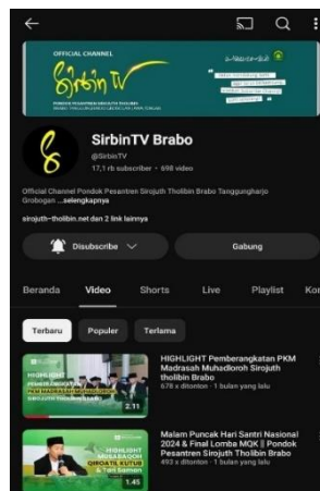
Gambar 1 channel YouTube SirbinTV