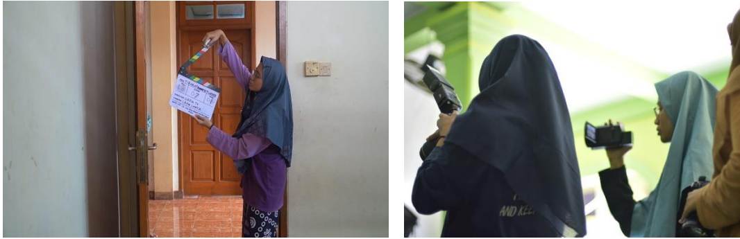
Gambar 9 Proses Shooting konten channel YouTube @SirbinTV