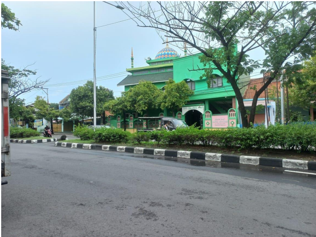
Masjid Jami Baitul Mutaqin Kota Semarang