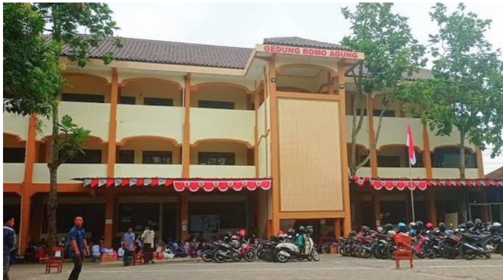
Gedung MA YAJRI Pondok Pesantren Sirojul Mukhlisin II