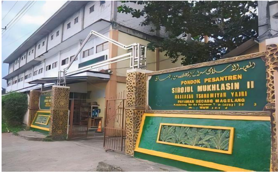
Tampak dari Depan Gerbang Masuk Pondok Pesantren Sirojul Mukhlasin II