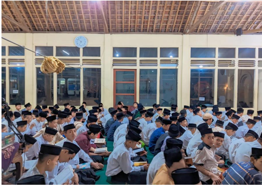
Ngaji Al Qur'an Ba'da Maghrib di Mushola Pondok Pesantren Sirojul Mukhlisin II