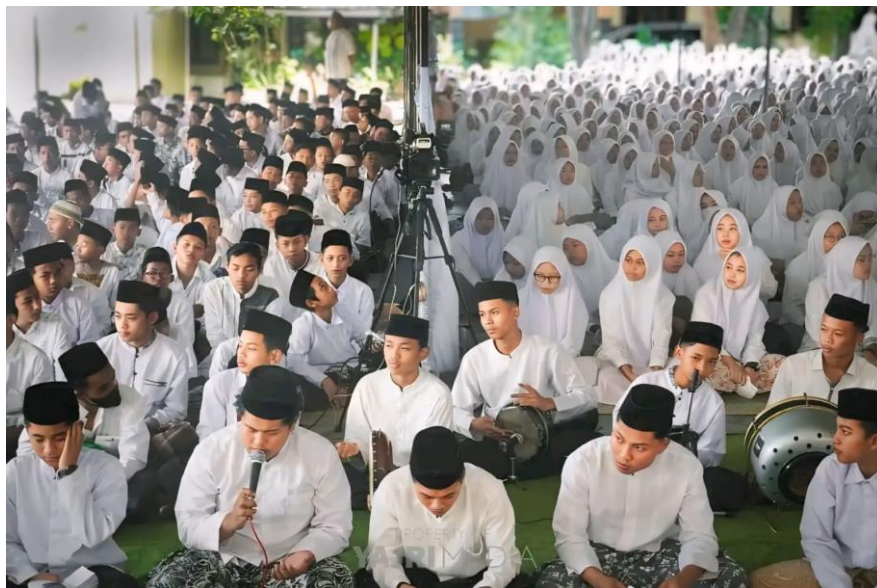
Kegiatan Memperingati Maulid Nabi di Halaman Pondok Pesantren Sirojul Mukhlisin II