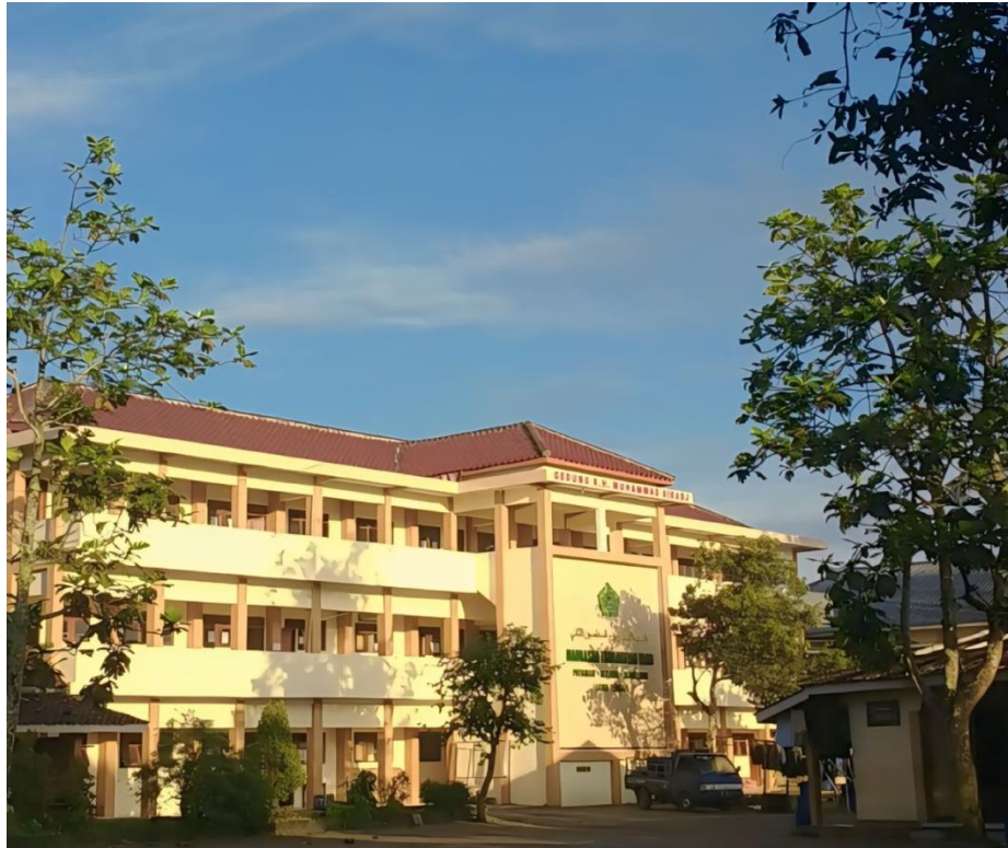
Gedung MTs YAJRI Pondok Pesantren Sirojul Mukhlisin II