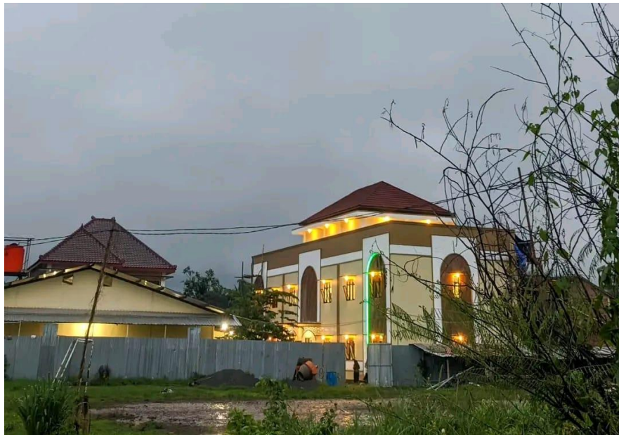
Gedung Baru Tahfidzul Qur'an Khusus Putri