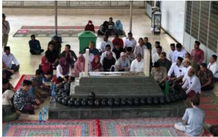
Gambar 3. 3 Kegiatan keagamaan (tahlil) di Makam Habib Kelling

dan meningkatkan kebersamaan dalam kegiatan keagamaan yang diadakan.