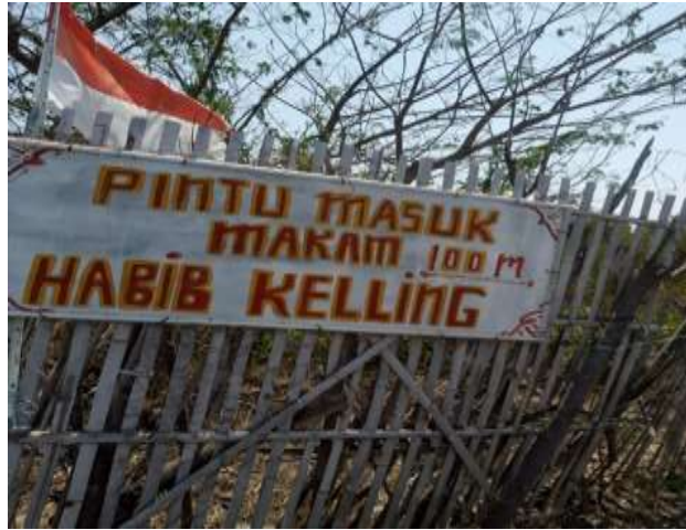
Gambar 3. 5 Papan pintu masuk makam Habib Kelling

Beberapa kendala juga dimiliki oleh makam Habib Kelling yaitu jarak tempuh dari pusat kota Indramayu yang cukup jauh, terutama bagi wisatawan luar daerah. Oleh karena itu pendukung yang bisa meminimalisir kendala tersebut adalah dengan bekerja sama dengan operator transportasi lokal untuk menyediakan transportasi umum yang lebih mudah diakses.