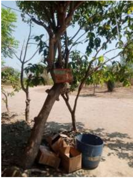
( Penempatan tong sampah)