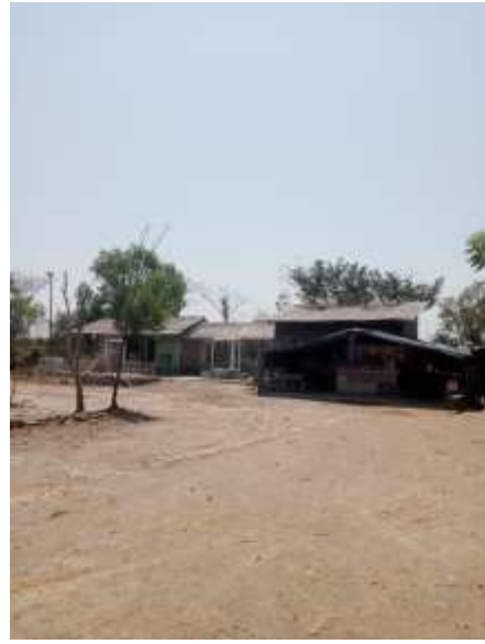
(Warung dan toilet)