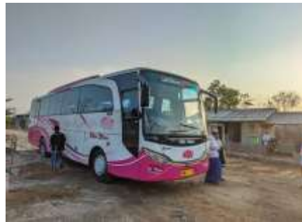
(Bis rombongan peziarah)