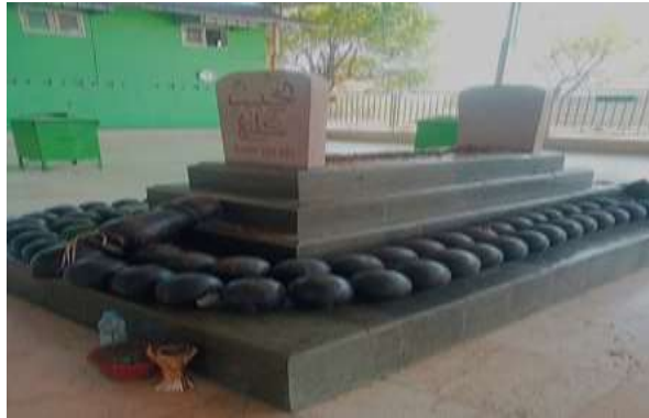
Gambar 3. 2 Batu Tasbih yang mengelilingi Makam Habib Kelling