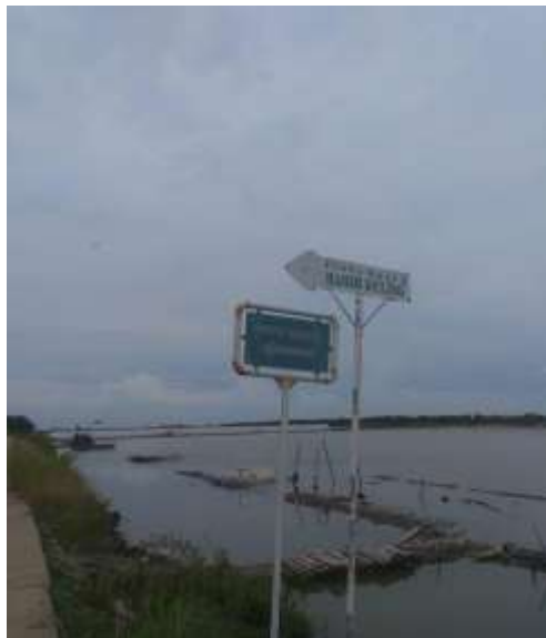
(Papan penunjuk jalan)