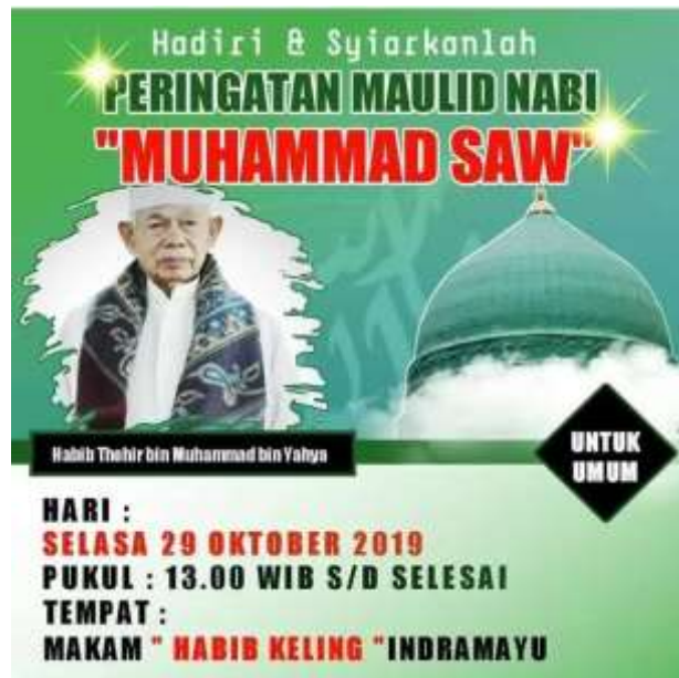
Gambar 3.6 pamflet kegiatan keagamaan

Acara keagamaan yang ada di Makam Habib Kelling memiliki potensi daya tarik yang kuat dan mampu mengundang partisipasi besar dari para peziarah. Hal ini memberikan kesempatan bagi umat islam untuk merayakan dan memperingati momen-momen keagamaan yang berarti. Para peziarah yang berkunjung ke makam ini mendapatkan kesempatan untuk ikut serta dalam ritual keagamaan, berdoa, menyatakan rasa syukur dan meningkatkan kebersamaan dalam kegiatan keagamaan yang diadakan.