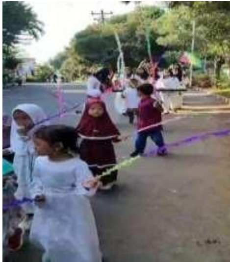
Dokumentasi karnaval Maulid