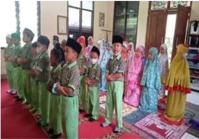
Dokumentasi kunjungan ke masjid