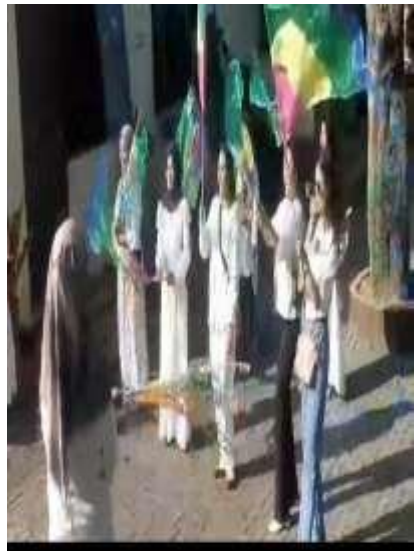
Dokumentasi keterlibatan orang tua dalam kegiatan