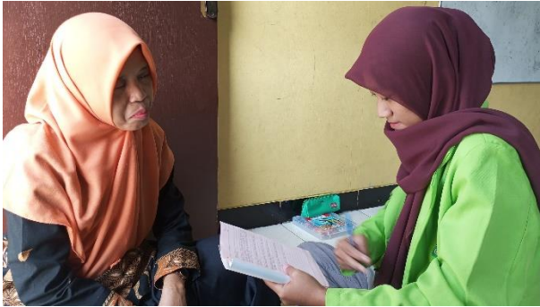
Gambar 2. Dokumentasi Wawancara dengan Pendidik