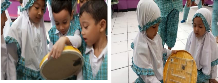
Gambar 1. Anak Memainkan Permainan Mini Maze Mengemudi