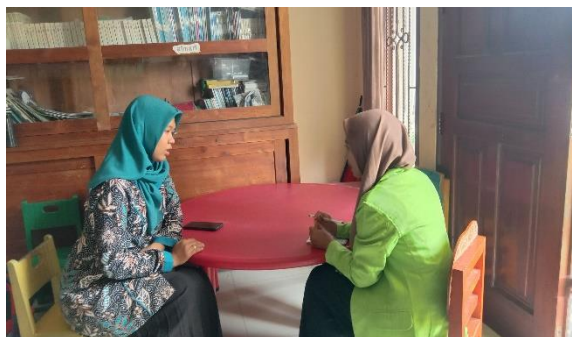
Gambar 3. Wawancara dengan guru kelas