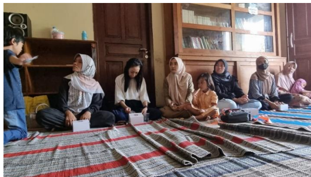
Gambar 6. Program parenting