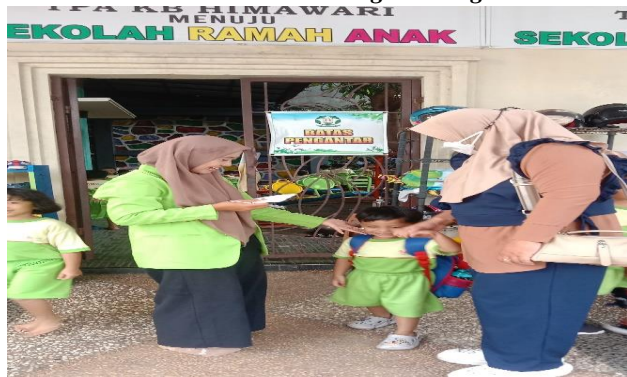
Gambar 5. Wawancara dengan orang tua