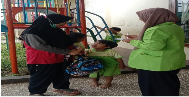
Gambar 4. Wawancara dengan orang tua