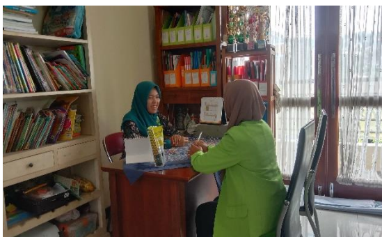
Gambar 2. Wawancara bagian tata usaha