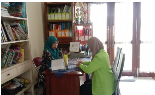
Gambar 1. Wawancara dengan Kepala sekolah TK Himawari